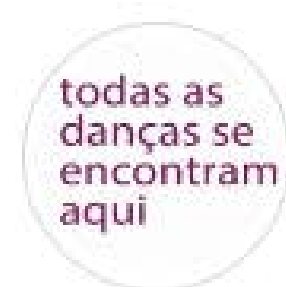
Abril pra Dança