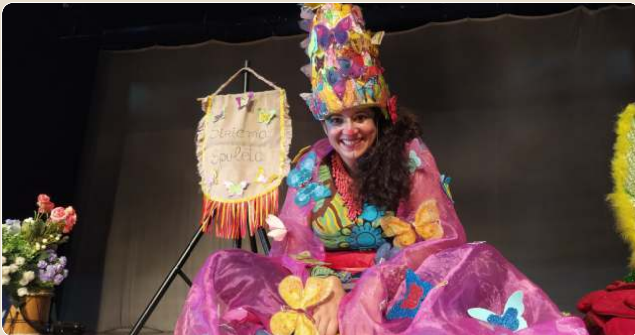
Nós e a Repolheira