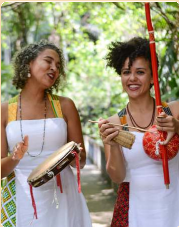
Chiquinha Gonzaga, a Maestrina!