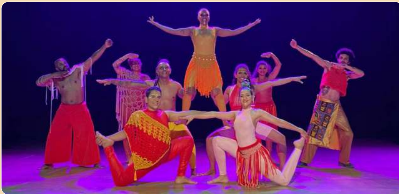
Circo de Ébanos