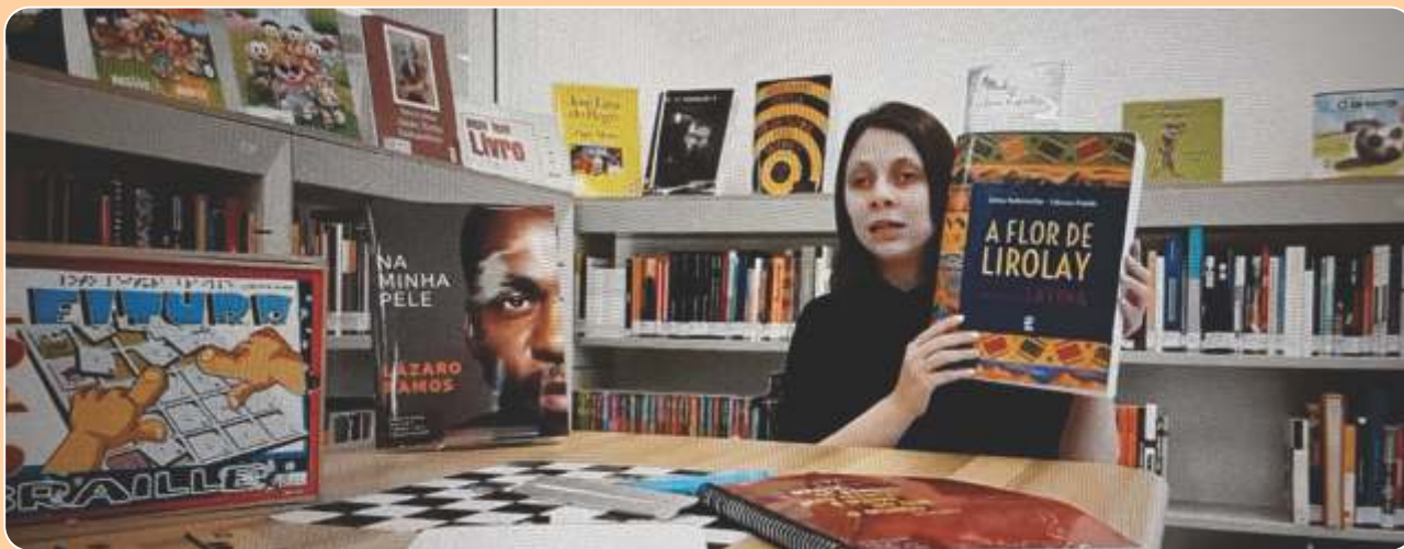
Contaçon de história uma arte de ver e sentir o mundo