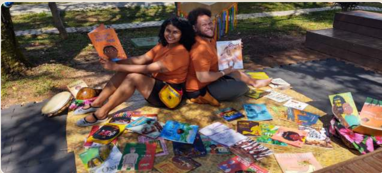
A nova roupa do Rei