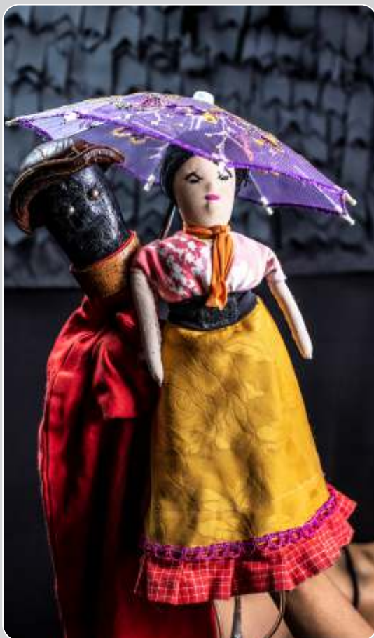
A Flor do Mamulengo