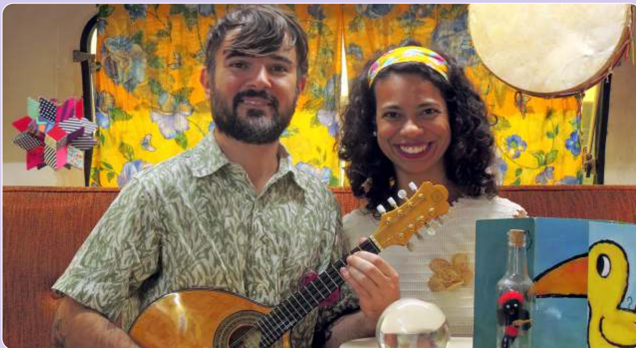
BebêLêteca com O casulo viajante