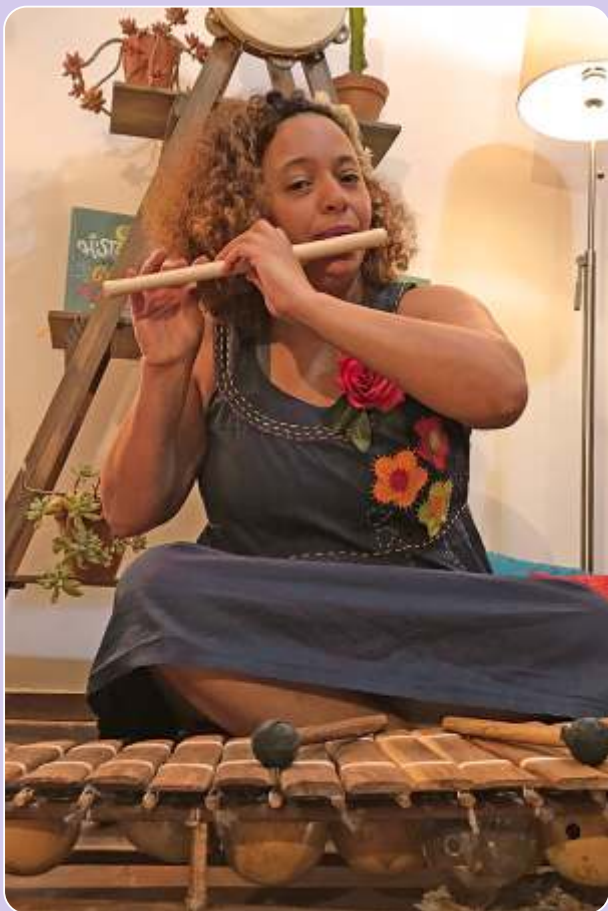
BebêLêteca Do Conto ao Livro com Sendero Cultural