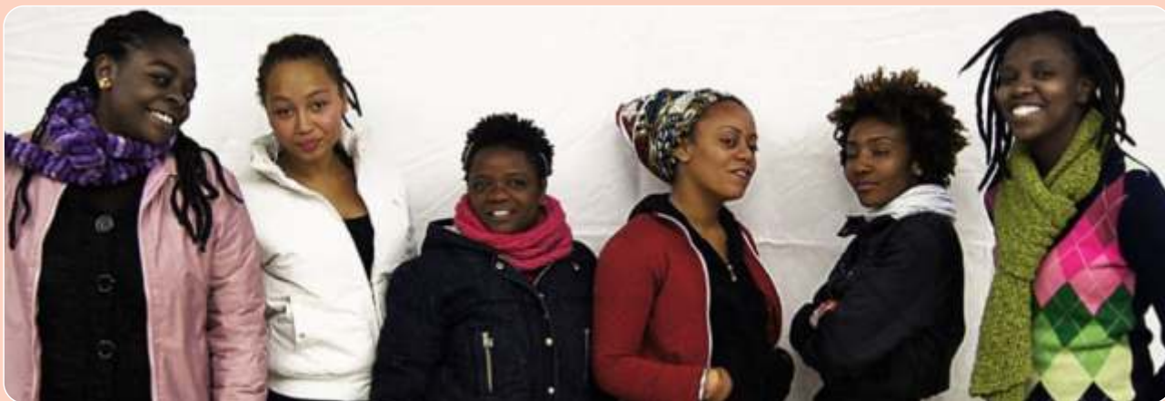
Sarau DI Rainha - Manifesto Crespo