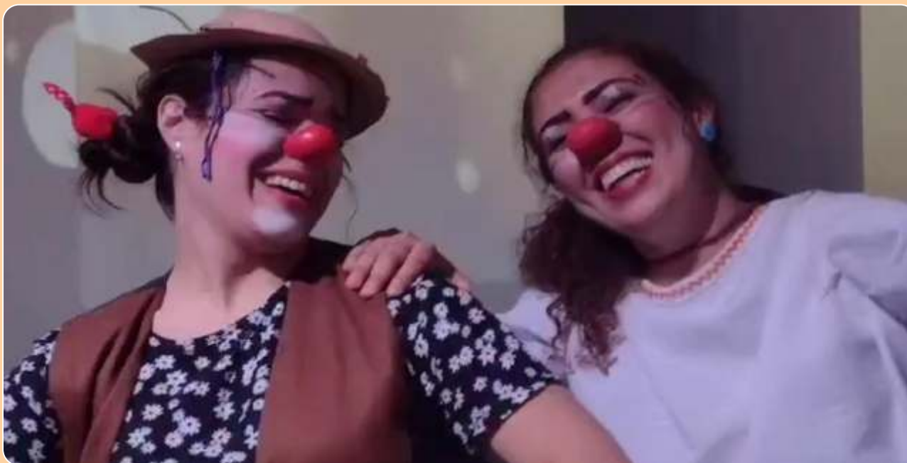
História de Timótia