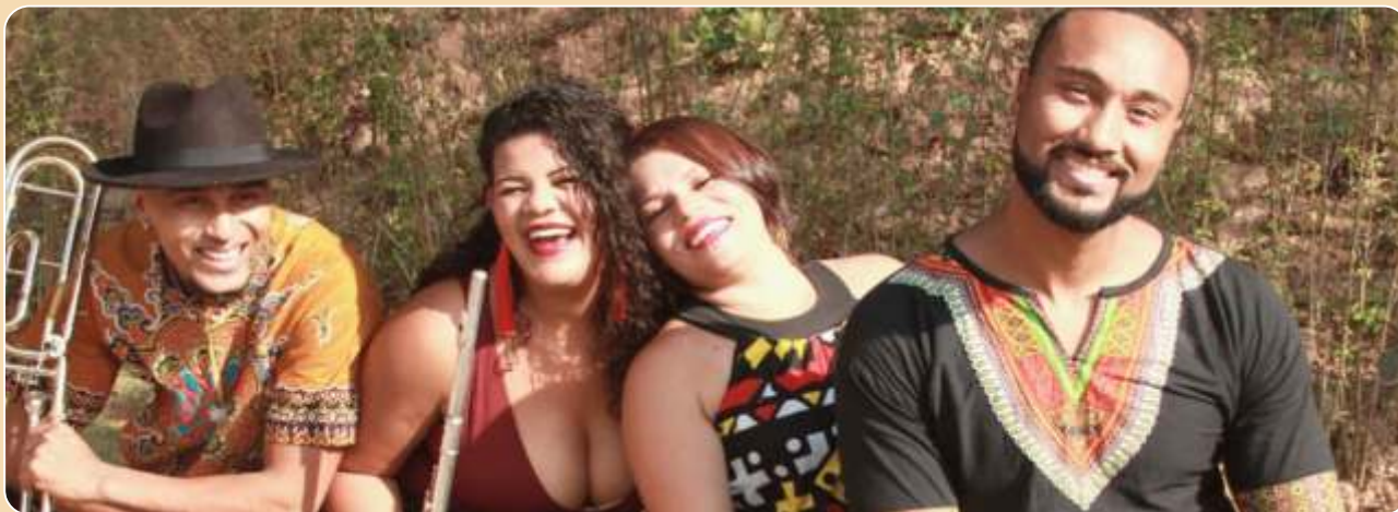
Shosholoza – Uma Viagem Sonora