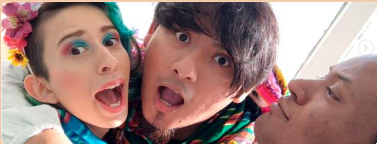
TAÍ - Território Artístico Imigrante Itinerante: Contando América Latina