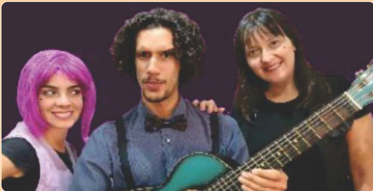
O Fantasma de Canterville