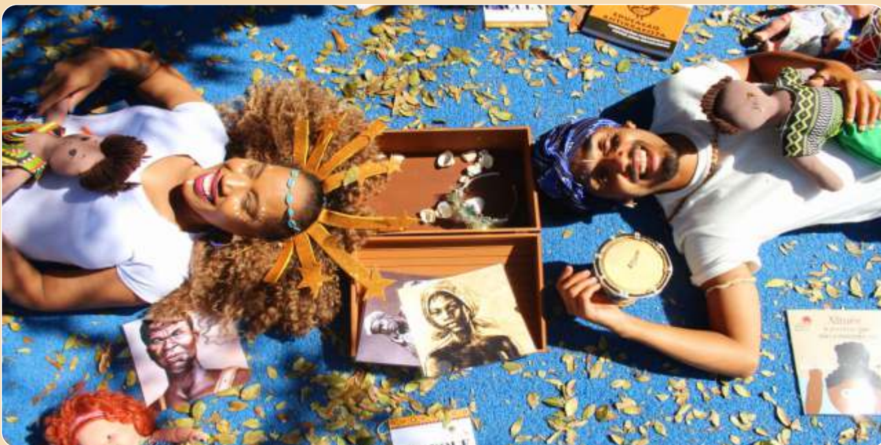
O baú de memórias de Aimée