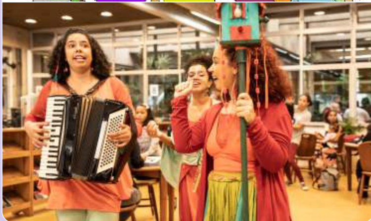
Cia. Passarinho Contou