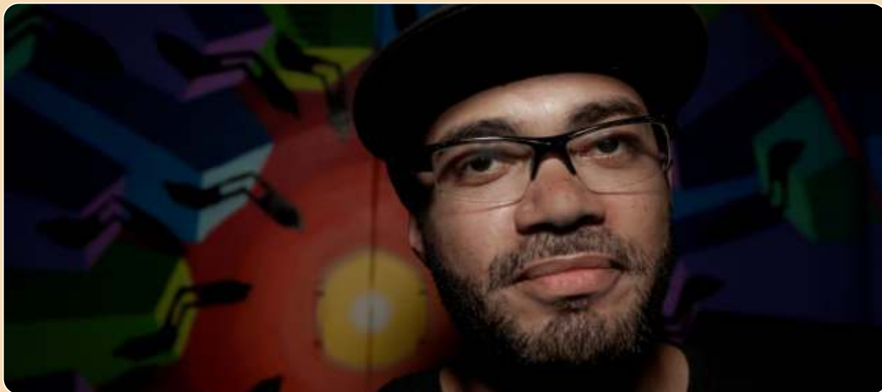
Roda de Leitura - Voa Besouro