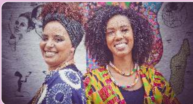
Contos e Cantos de Guiné Bissau