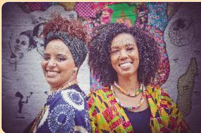
Contos e Cantos de Guiné Bissau