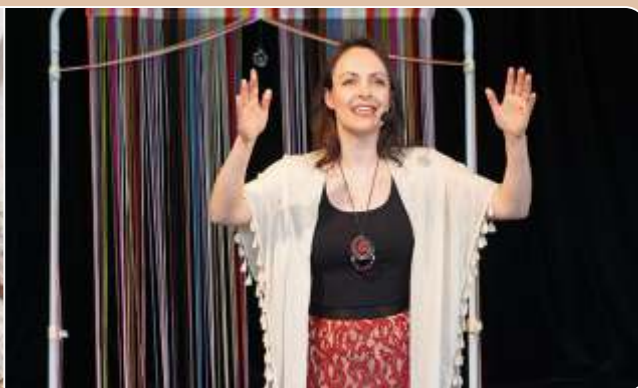
Histórias sobre mulheres: a mulher que tece o mundo