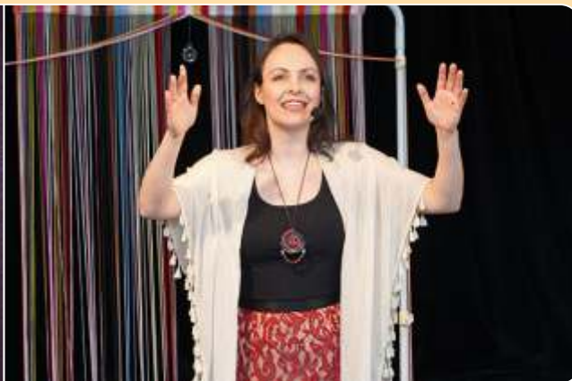
Histórias sobre mulheres: a mulher que tece o mundo