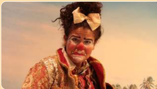
A Mulher Bala