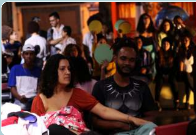
Slam Fluxo - As Mina no Toque