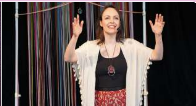
Histórias sobre mulheres: a mulher que tece o mundo