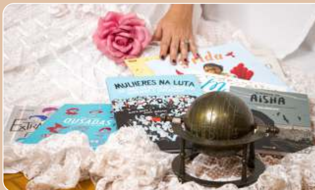
Mulheres que poetizam o Mundo