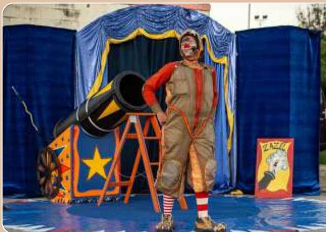
A Mulher Bala