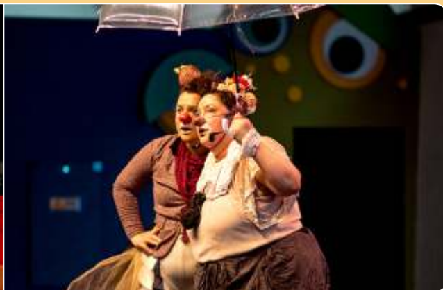
A Fabulosa Saga de Cangica Espirulina D'Esbaratina