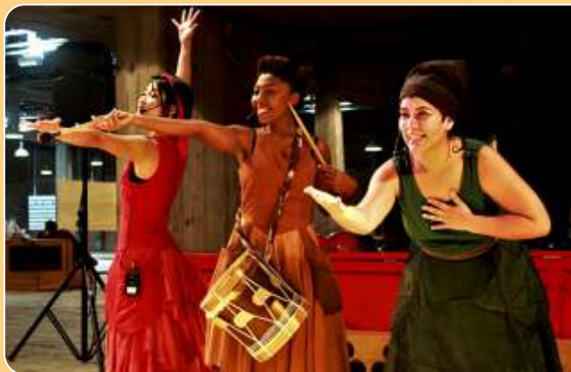
Tramarias: Libertando-se das tramas