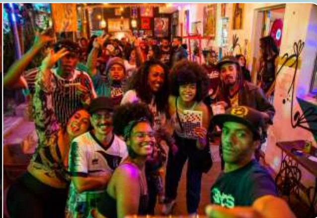
CliPoesia - Hiphopologia e Divas