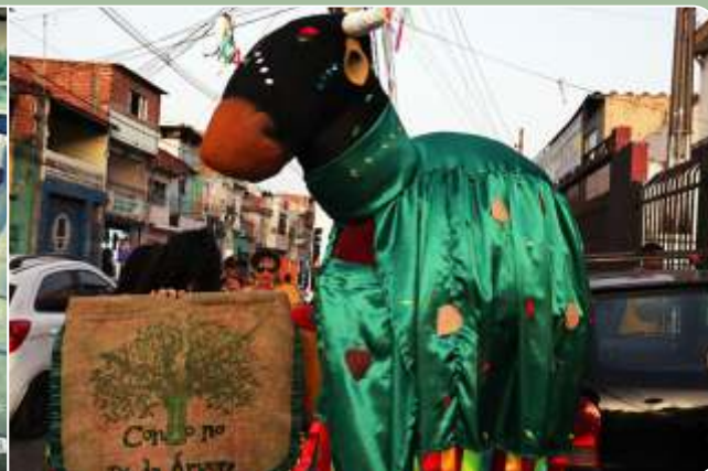
Cortejo do Boi Folhinha