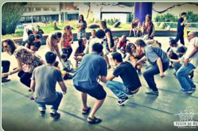
Cortejo e Brincadeiras Culturais