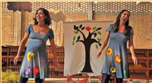
Laços de mãe