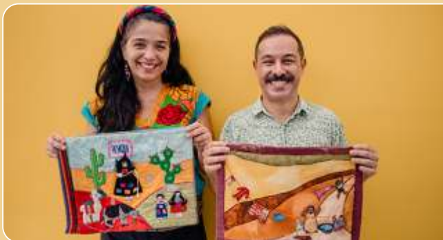
Tapetes Contadores 25 anos