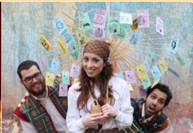
Brincadeiras de Cordel