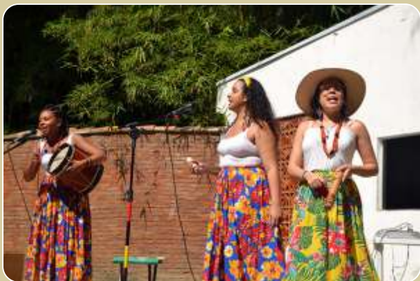
As Contadeiras e Seus Canteiros