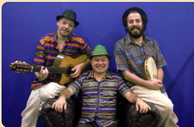
Fantamas da São Paulo Antiga