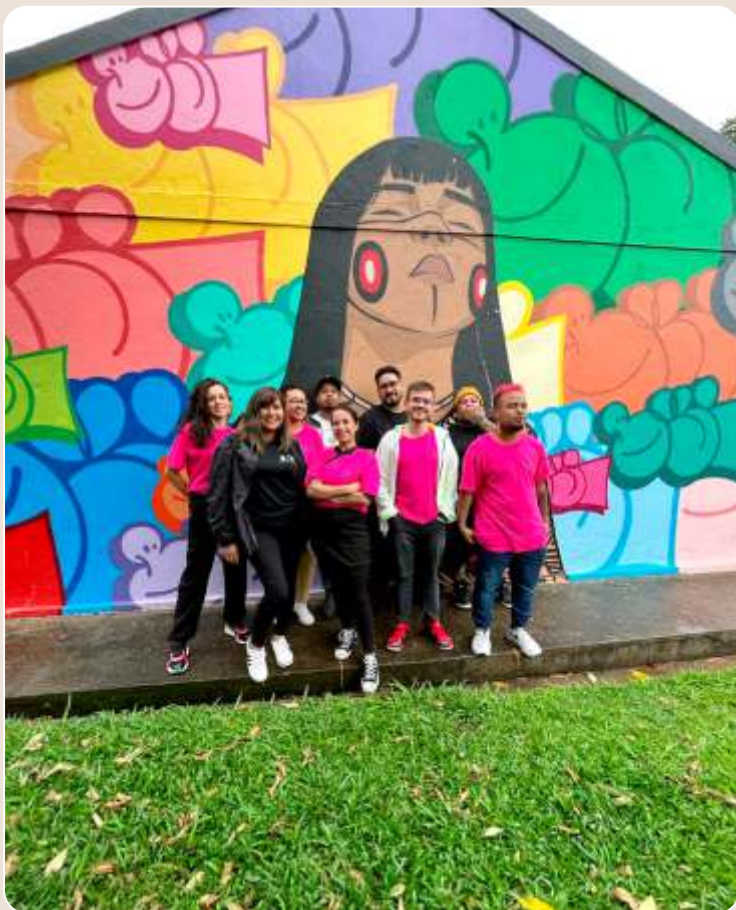
Revoada dos Versos