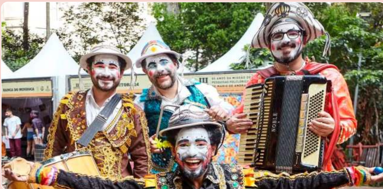
Sertão Poesias e Versos