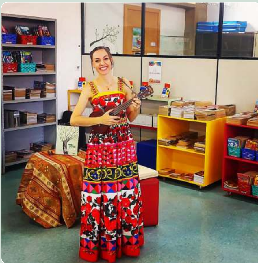
O Menino Tom