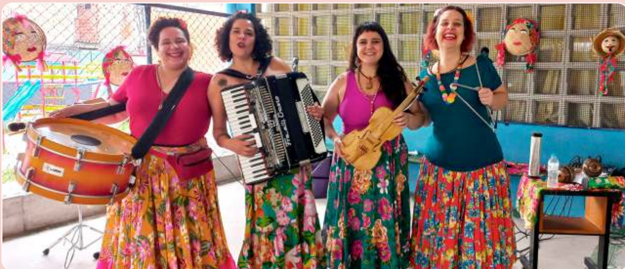
Acontecendo e Tecendo Histórias