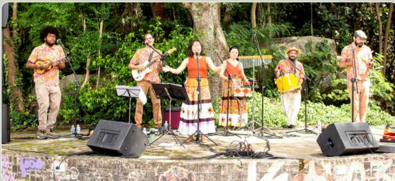
No Terreiro de Vovó apresenta Histórias pra Cantar e Encantar