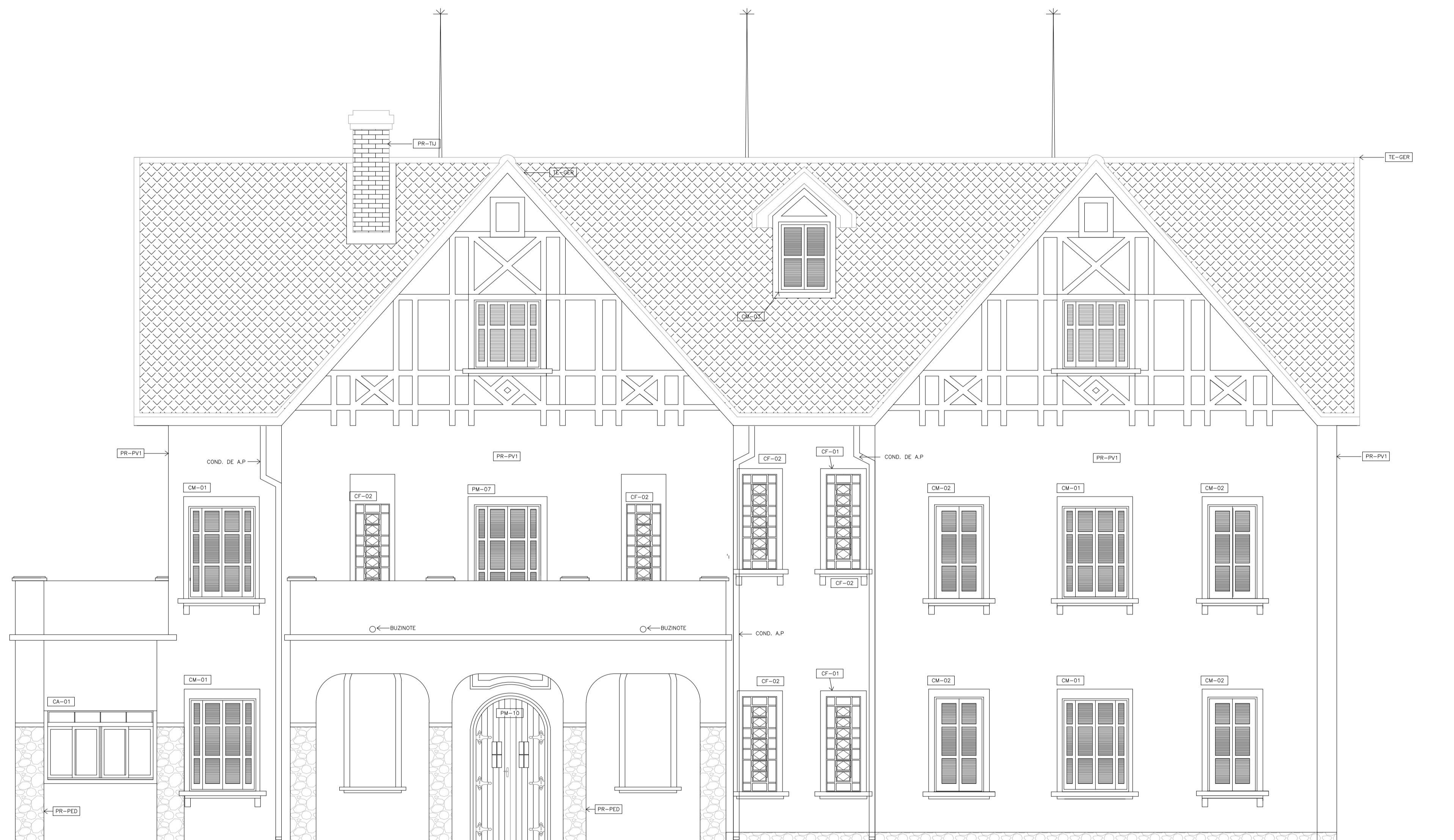
ELEVAÇÃO 1 ESCALA - 1:50