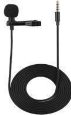
microfone de lapela