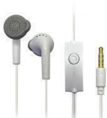
fone de ouvido com microfone

qualidade e definição do áudio, recomenda-se a utilização de um microfone (lapela), caso seja possível, ou também a utilização do próprio fone do celular que geralmente vem com microfone.