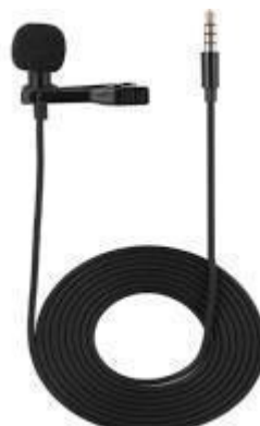
microfone de lapela