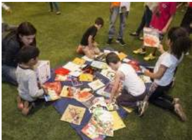
Oficina de leitura – clube do livro com os contadores de história