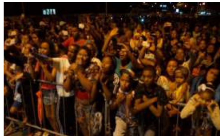
interação do público nos eventos