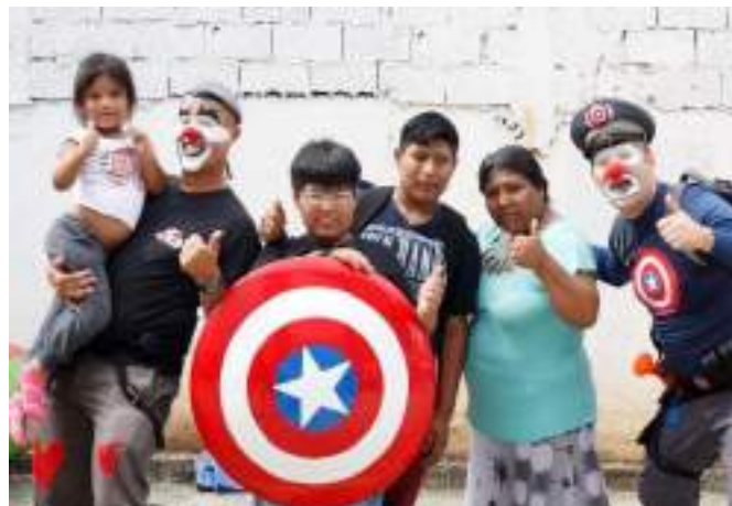
MPS da alegria