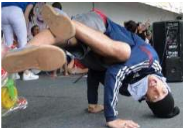
Oficina de hip hop