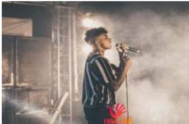
Intérprete MC Livinho