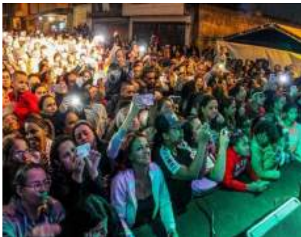
Interação do público nos eventos