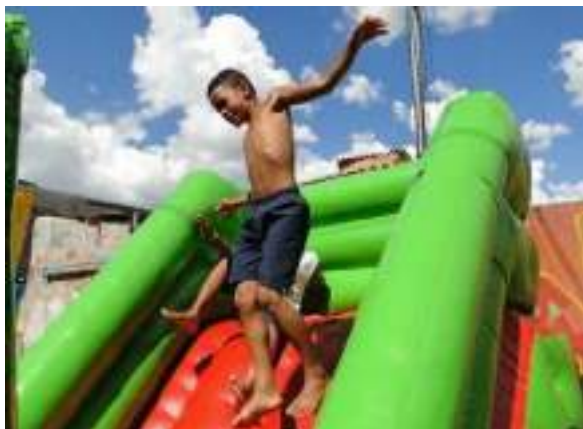
Espaço kids com monitores da alegria