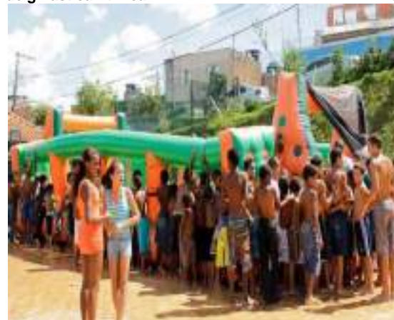
Espaço kids com monitores da alegria