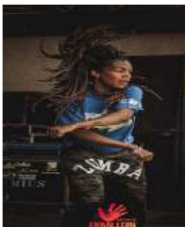
Oficina de zumba