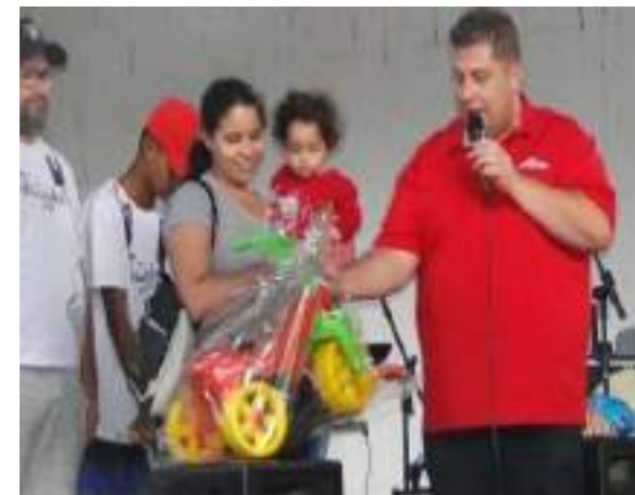
Distribuição gratuita de alimentos e brinquedos