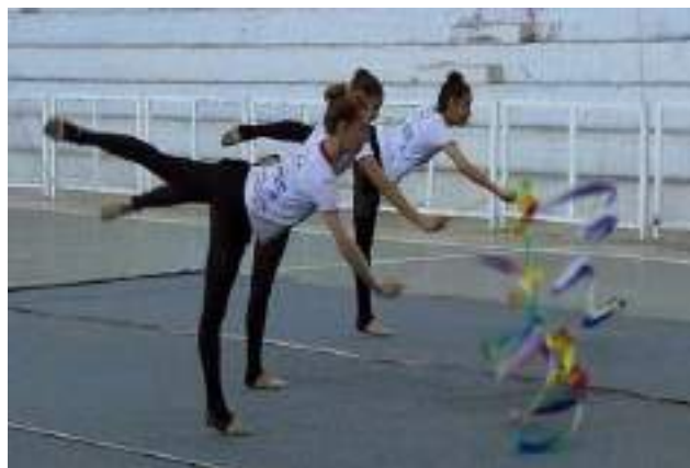
Oficina de ginástica rítmica