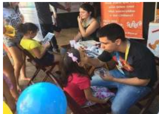
Monitores da alegria, equipe de pinturas