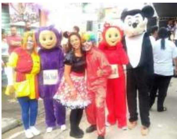
Espaço kids com monitores da alegria