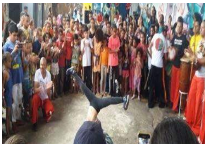
Oficina de capoeira