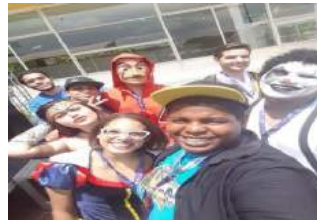
Espaço kids com monitores da alegria