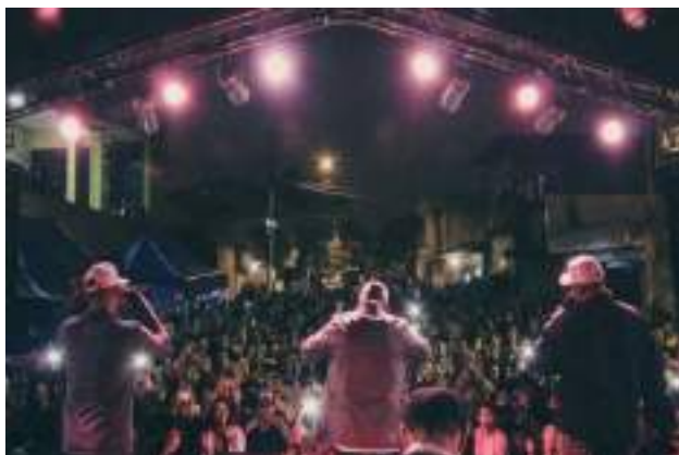
Interação do público nos eventos