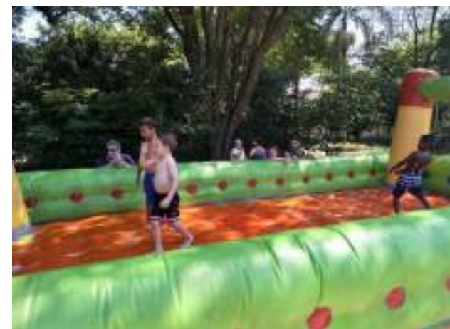
Espaço kids com monitores da alegria