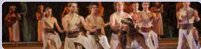
Píramo e Tisbe

26 de agosto (sex), 15h – BP Monteiro Lobato