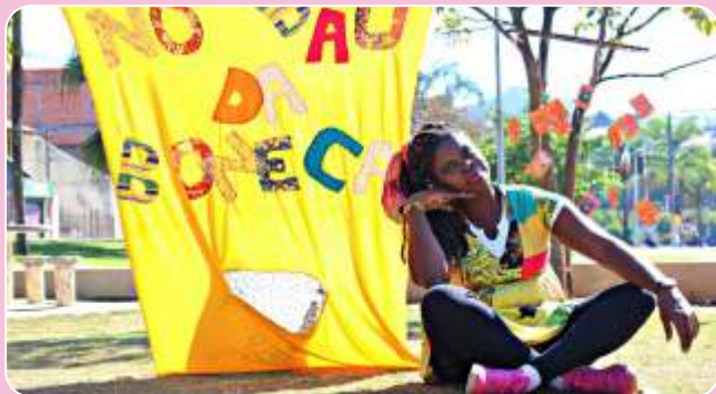
Cia. Baú da Boneca