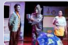
Tudo sob controle?

6 de agosto (sáb), 11h – BP Clarice Lispector