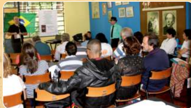
Café com Poesia