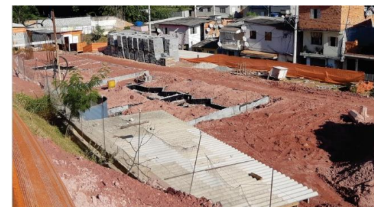
Condomínio D – Blocos A e B