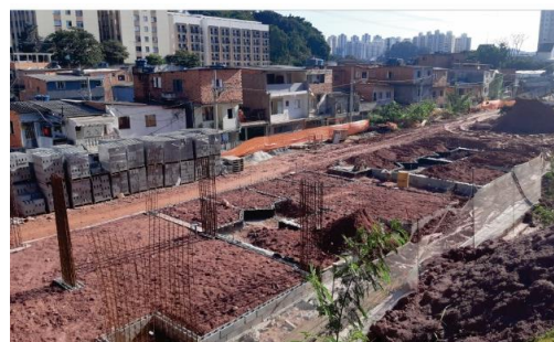
Condomínio D – Bloco B