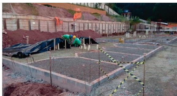
Condomínio D – Bloco A