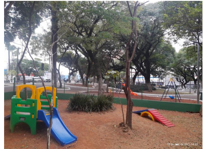
Foto tirada em mai/2022