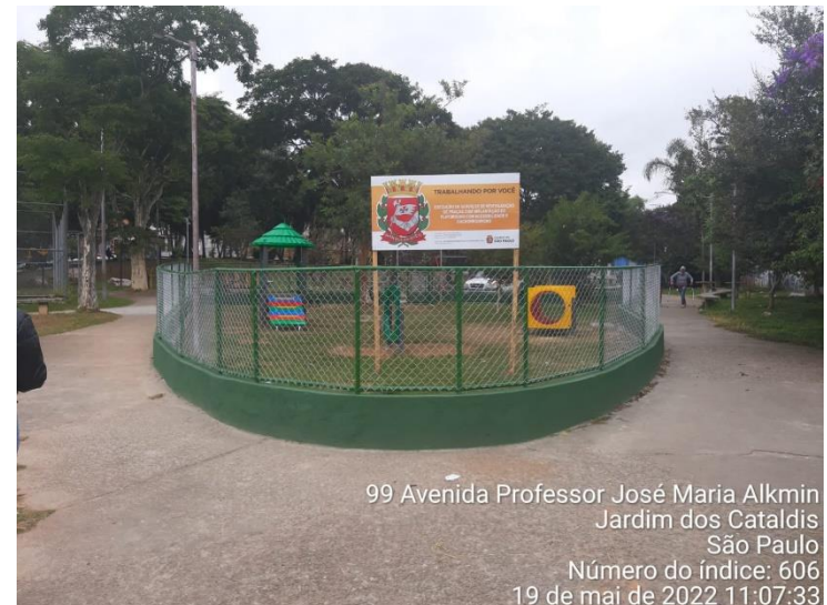
Foto tirada em mai/2022