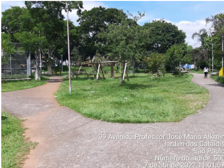
Foto tirada em abr/2022