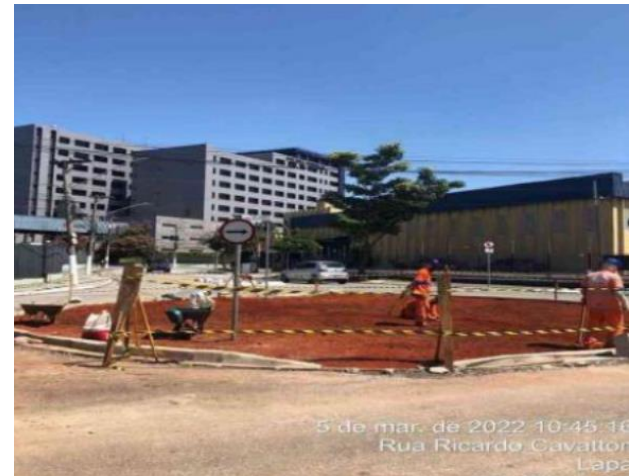
Foto tirada em mar/2022