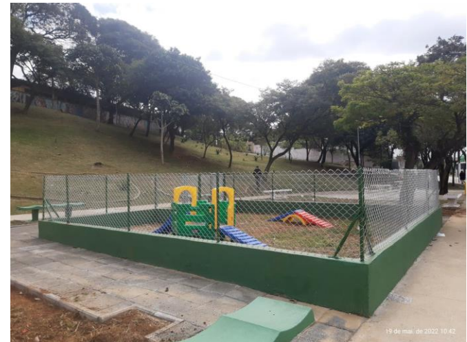
Foto tirada em mai/2022