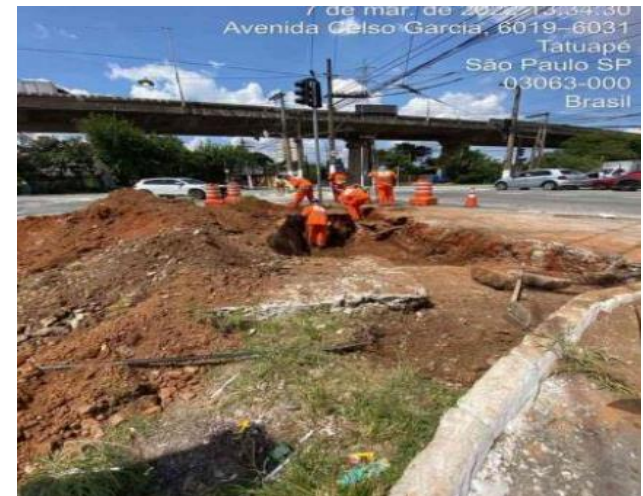
Foto tirada em mar/2022