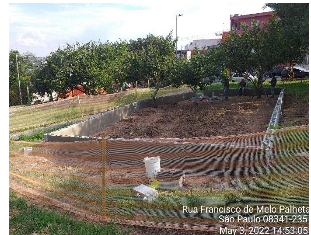
Foto tirada em mai/2022