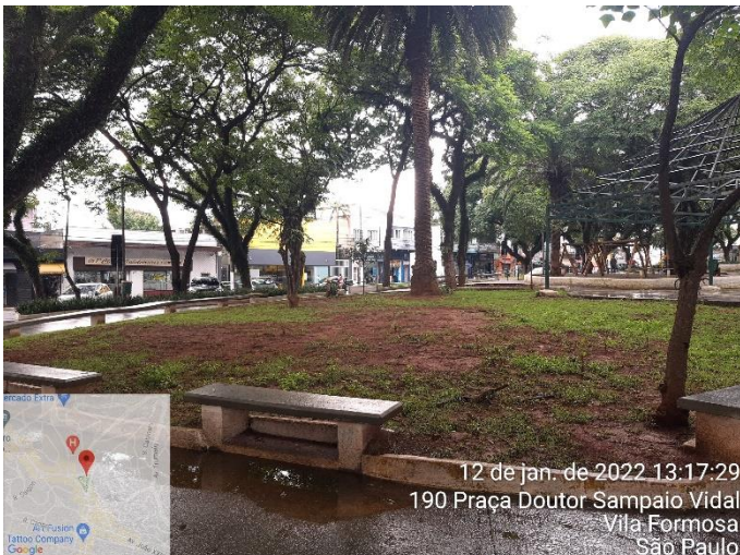
Foto tirada em jan/2022