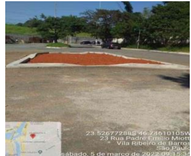
Foto tirada em mar/2022