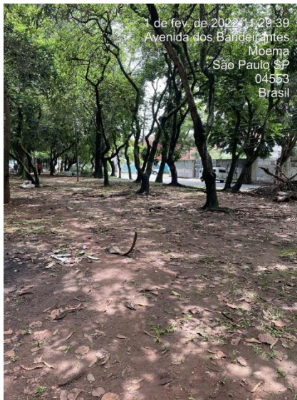
Foto tirada em fev/2022