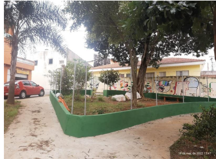
Foto tirada em mai/2022