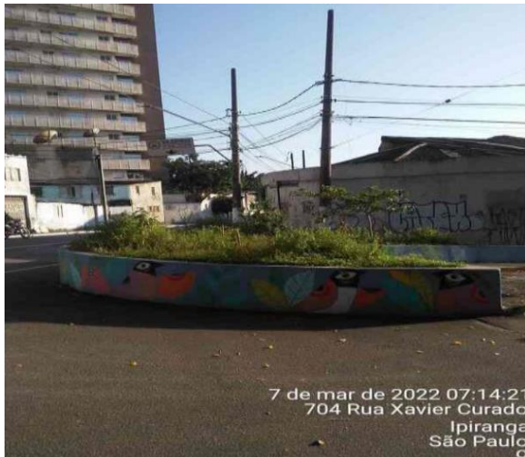
Foto tirada em mar/2022