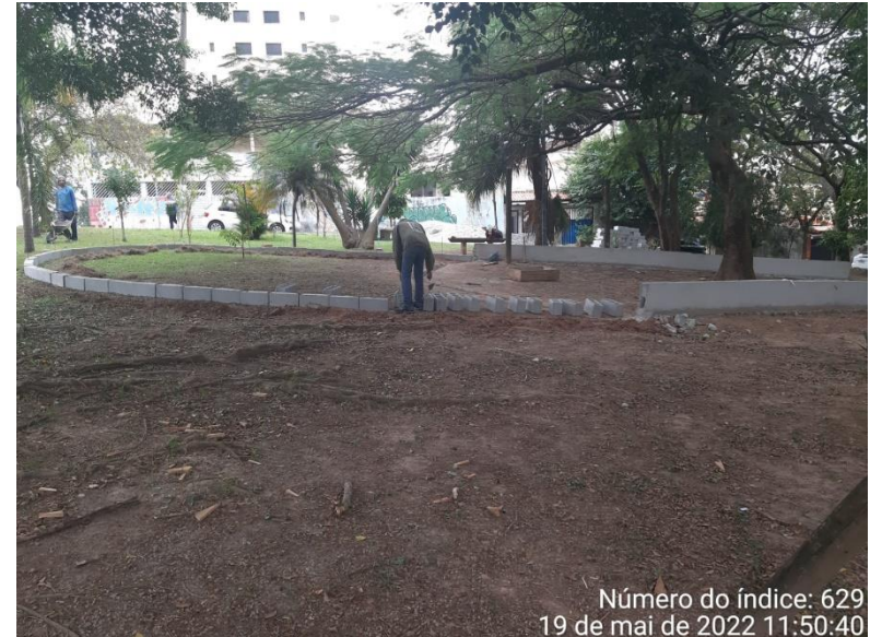
Foto tirada em mai/2022