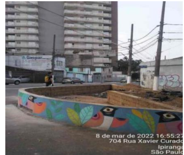
Foto tirada em mar/2022