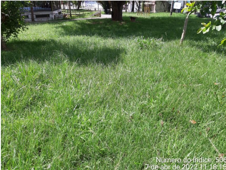
Foto tirada em abr/2022