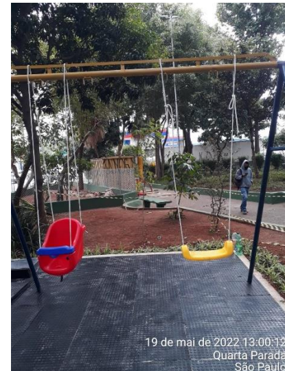
Foto tirada em mai/2022