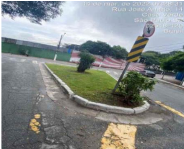
Foto tirada em mar/2022