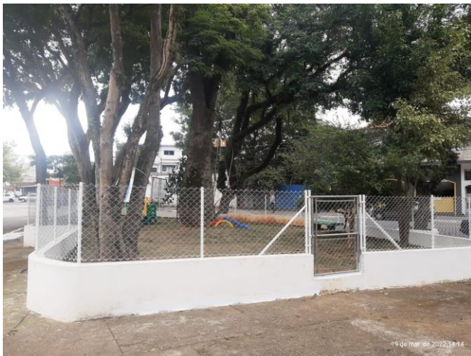
Foto tirada em mai/2022