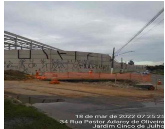
Foto tirada em mar/2022