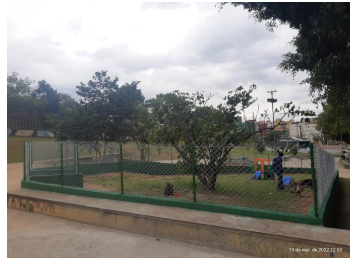
Foto tirada em mai/2022