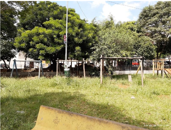
Foto tirada em mai/2022