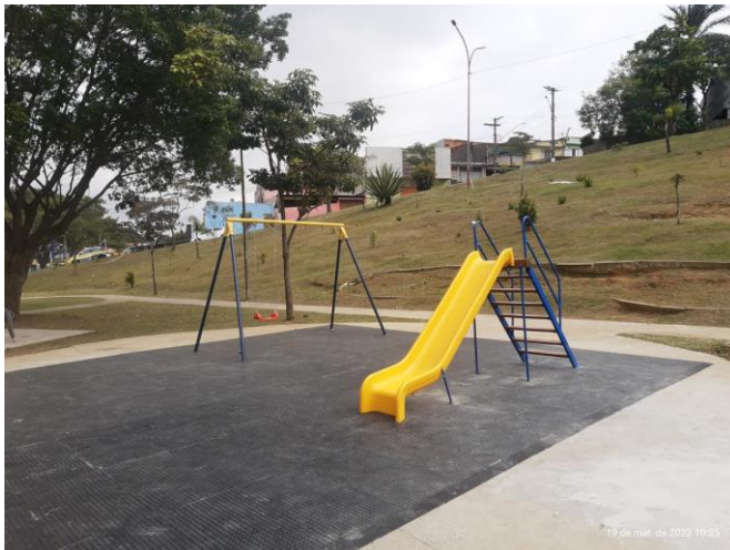
Foto tirada em mai/2022