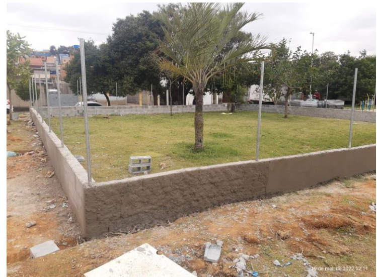
Foto tirada em mai/2022