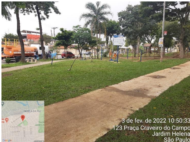
Foto tirada em fev/2022