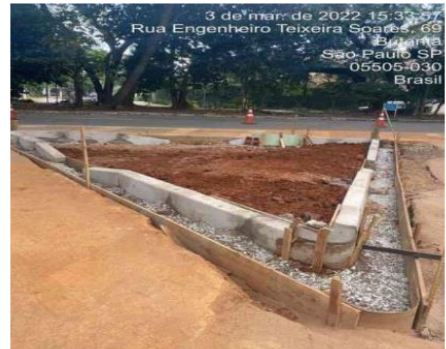
Foto tirada em mar/2022