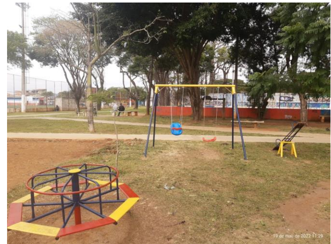
Foto tirada em mai/2022