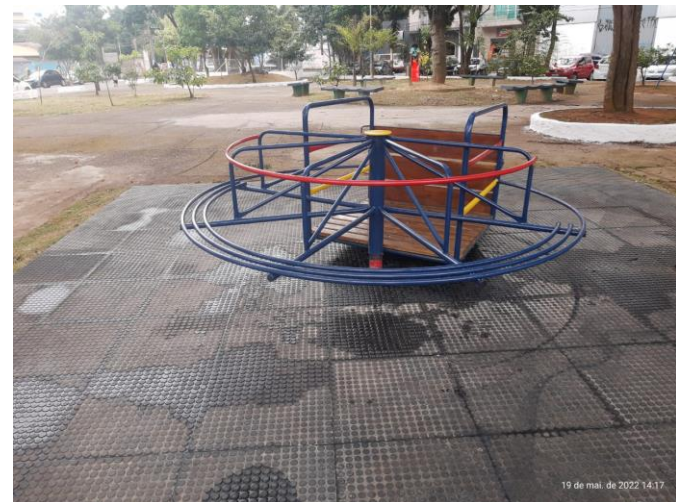
Foto tirada em mai/2022