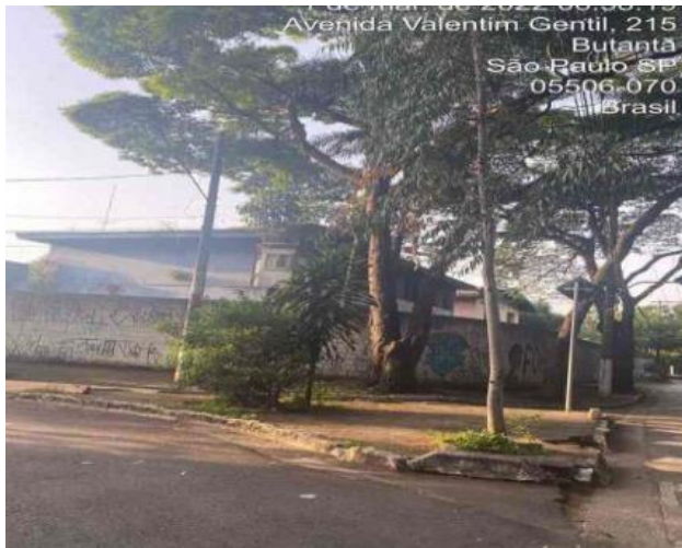
Foto tirada em mar/2022