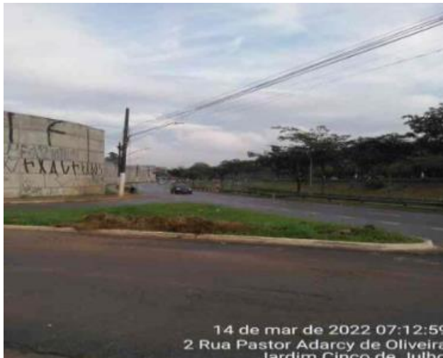
Foto tirada em mar/2022