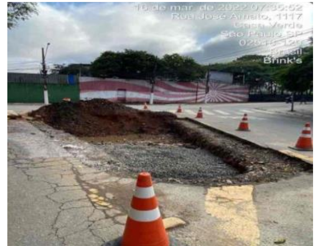
Foto tirada em mar/2022