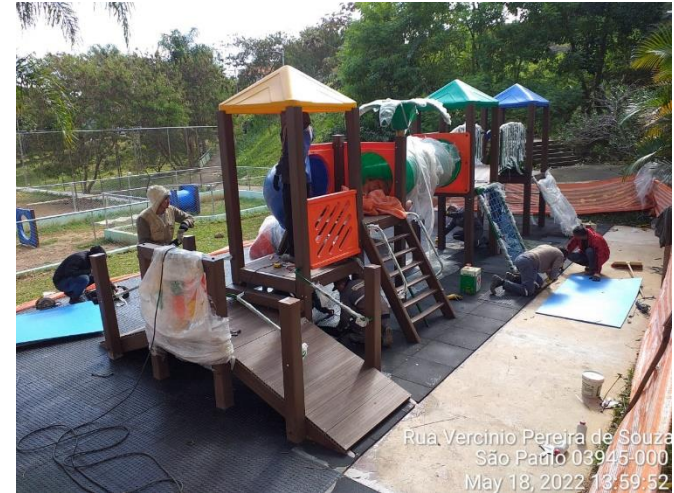
Foto tirada em mai/2022