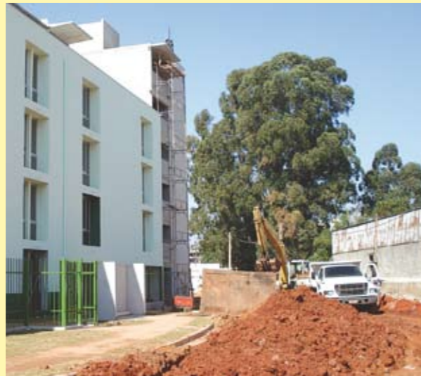
Em obras: construção de prédios no novo bairro

Você conhece a Cidade Nova Heliópolis? É o novo bairro que a Secretaria de Habitação está construindo para substituir a maior favela de São Paulo. Estão sendo realizadas obras de canalização de córregos, construção de moradias, ruas, calçadas, esgotos e galerias. Para realizar as obras é necessário retirar moradias precárias e vielas. As pessoas que saem recebem auxílio habitacional da Prefeitura, podendo ir morar em outro local ou permanecer em Heliópolis. No final, aqueles que continuarem morando no novo bairro poderão adquirir seus imóveis da Prefeitura, realizando o sonho da casa própria.