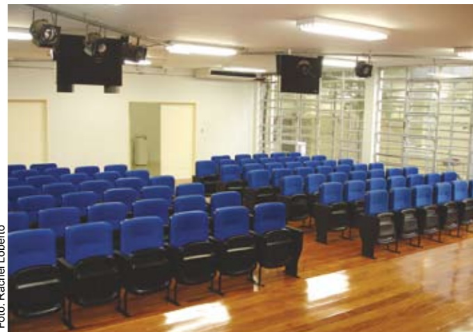
Após a reforma: auditório agora tem cadeiras e piso novos