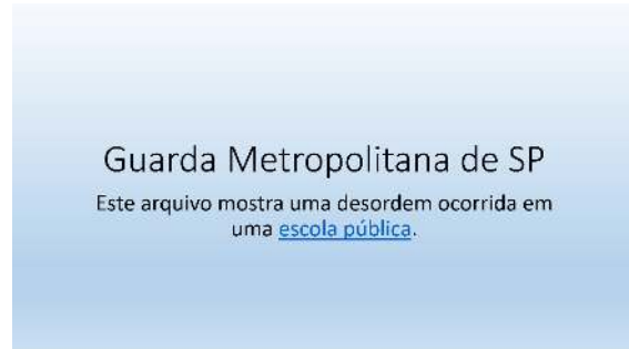
Figura 2: slide apresentado por Bárbara

Bárbara está preparando uma apresentação no MS PowerPoint 2010 para sua equipe e deparou com informações que gostaria de inserir para que ficassem disponíveis e sincronizadas com a internet de forma online , com o intuito de mostrá-las quando fosse clicada no texto escola pública, conforme a figura 2.