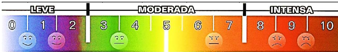
ESCALA VISUAL ANALÓGICA - EVA