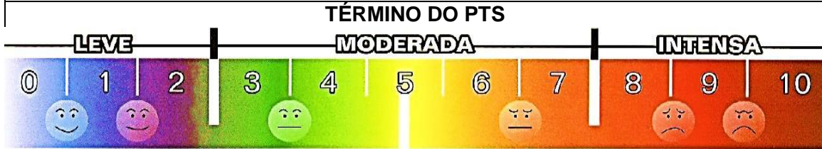
ESCALA VISUAL ANALÓGICA - EVA