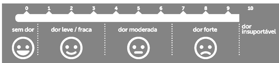
Figura 2. Escala Verbal Numérica

A avaliação da intensidade da dor pode ser feita por meio de escalas, que auxiliam no registro da evolução e no planejamento do tratamento 62,63 . Descritores verbais e escalas numéricas de dor parecem ser preferíveis em idosos 64 , comparada à tradicional escala visual analógica (EVA). Os descritores verbais da dor permitem que o paciente forneça e indique as características da dor (nenhuma dor, dor leve, dor moderada, dor intensa, maior dor) e são de extrema importância para o diagnóstico e acompanhamento do quadro 55,65,66 . Instrumentos validados estão disponíveis para indivíduos de todas as idades e com diferentes habilidades mentais, como as escalas de faces 67-69 . Entretanto, nenhuma ferramenta é considerada padrão-ouro para avaliação da dor, devendo-se utilizar aquela ferramenta que melhor se adequa ao paciente.