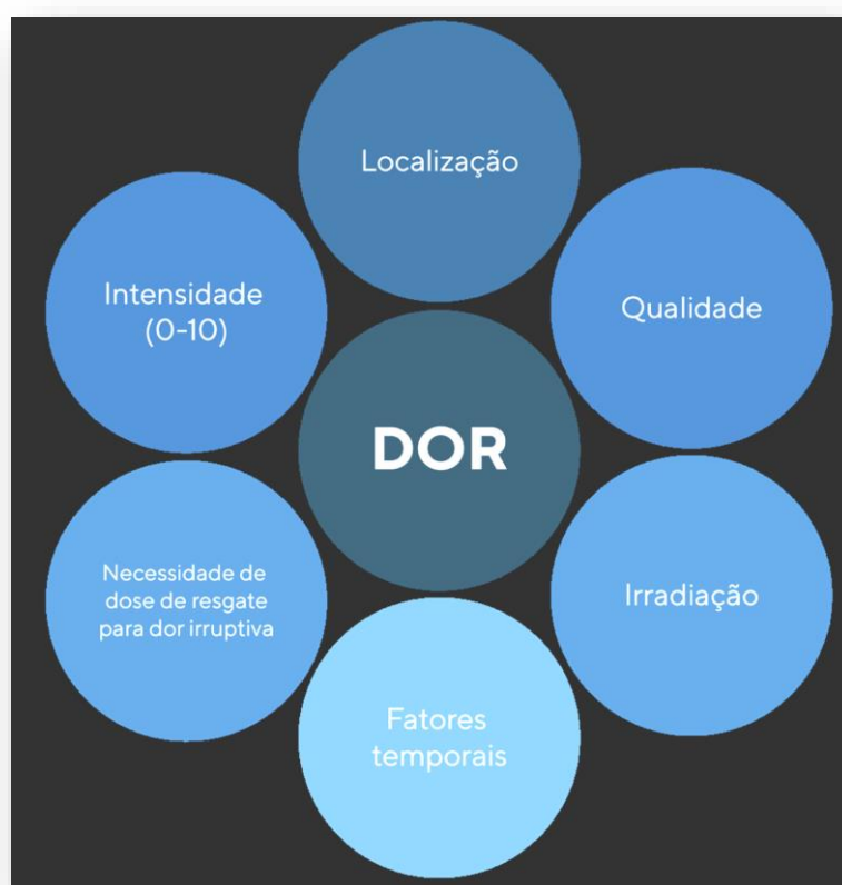
Figura 1. Aspectos a serem avaliados na dor

Por meio da anamnese e do exame físico, é possível entender e categorizar a dor que a pessoa apresenta, tornando viável elencar as possíveis doenças e condições clínicas que a levaram à dor crônica. Quando necessário, deve-se proceder com os exames complementares indicados para a confirmação diagnóstica 47, 48 .