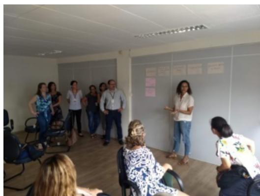
Um dos grupos Diversidade apresentando suas tarjetas e a síntese da discussão em grupo