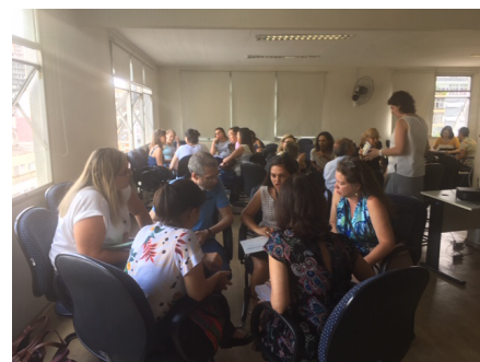
Grupos diversidade discutindo sobre fatores de risco e/ou proteção