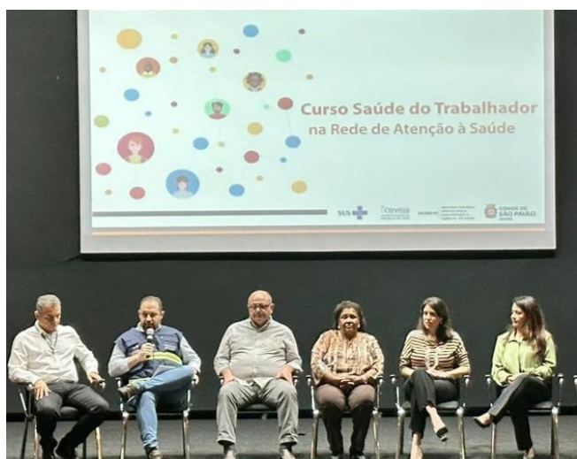
Mesa de abertura do primeiro módulo do curso “Saúde do Trabalhador na rede de atenção à Saúde”

Com 9 módulos, o curso conta com 2 encontros presenciais (módulo 1 e 9) e aulas gravadas com temas relacionadas à fatores de risco à saúde do trabalhador e doenças relacionadas ao trabalho.