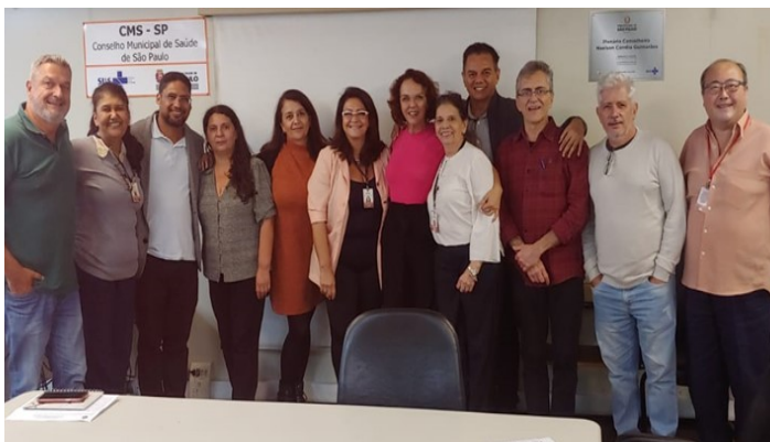
Participação da reunião da CIIST no mês de maio.