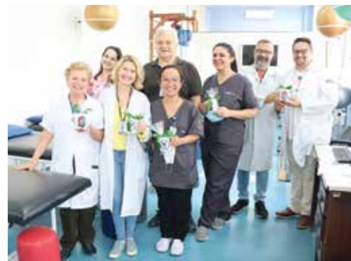
Parte da equipe de Fisioterapia