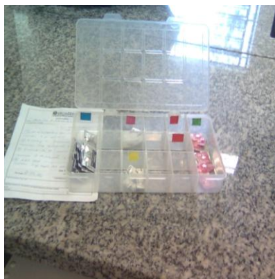
Kit terapêutico com indicação por cores.

Outra experiência positiva foi a elaboração de kits terapêuticos para educação e instrução do paciente quanto ao uso das medicações para posterior cadastro no programa.