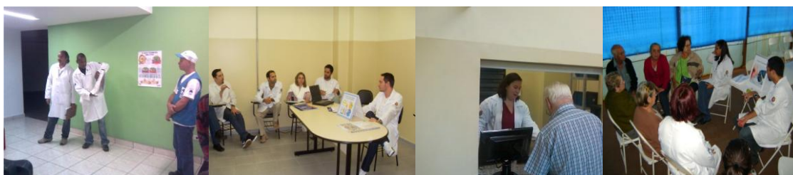
Grupos em saúde, reuniões com a equipe multiprofissional, atenção farmacêutica.