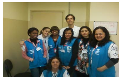
Educação Continuada com as equipes da UBS.