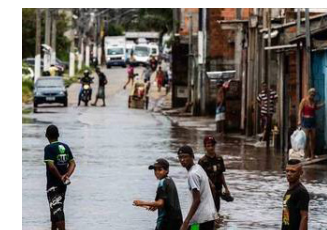
Imagem 1: https://spdiario.com.br/moradores-sofrem-com-infestacao-de-ratos-na-zona-sul-de-sp/ Imagem 2: https://www.prefeitura.sp.gov.br/cidade/secretarias/subprefeituras/jacana_tremembe/noticias/?p=90369

Imagem 3: Chuvas afetam vida dos moradores da Vila Itaim, zona leste de São Paulo Edu Garcia/R7 https://noticias.r7.com/sao-paulo/buracos-e-carros-submersos-zona-leste-de-sp-sofre-com-enchentes-13022019