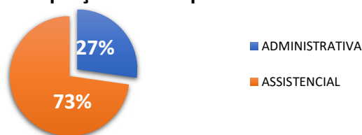
Proporção das Despesas