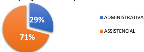
Proporção das Despesas