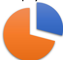
Proporção das Despesas