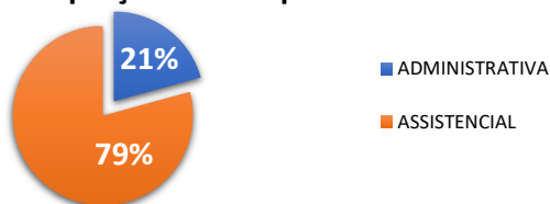
Proporção das Despesas