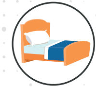
Roupas, toalhas e lençóis utilizados pela pessoa doente

E ou por gotículas respiratórias em contato próximo e prolongado.