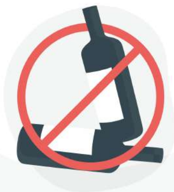
Consumo de bebidas alcoólicas