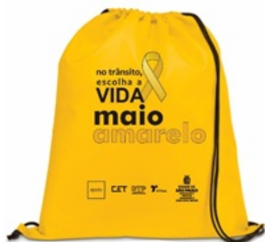
medida padrão - 45 x 35 cm