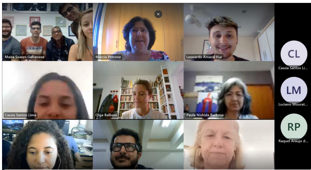
Finalização da Reunião