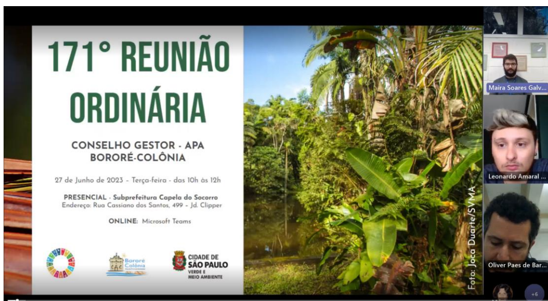
Início da Reunião

Meet Anexo III – Registro fotográfico das apresentações da 171ª RO do Conselho Gestor da APA BC – Dia 27/06/2023, das 10h às 12h, - Reunião Híbrida - Presencial – Subprefeitura Capela do Socorro e Plataforma Microsoft Teams