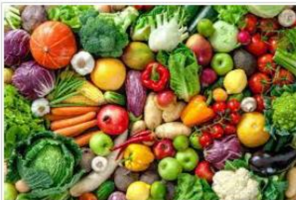
Consea/SP prepara VI Conferência Estadual de Segurança Alimentar e Nutricional Sustentável

Postado em: 07/07/2023 - 21:15 | Por: CONSEA