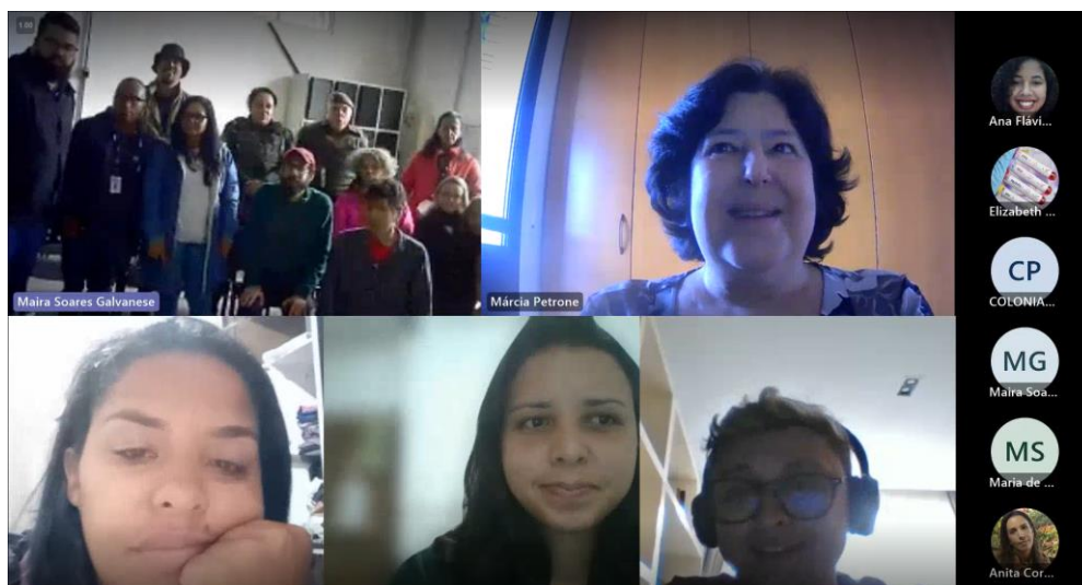
Finalização da Reunião