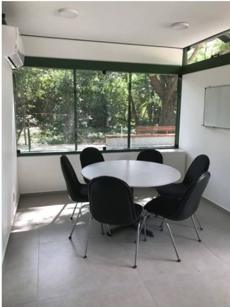
Sala de Apoio