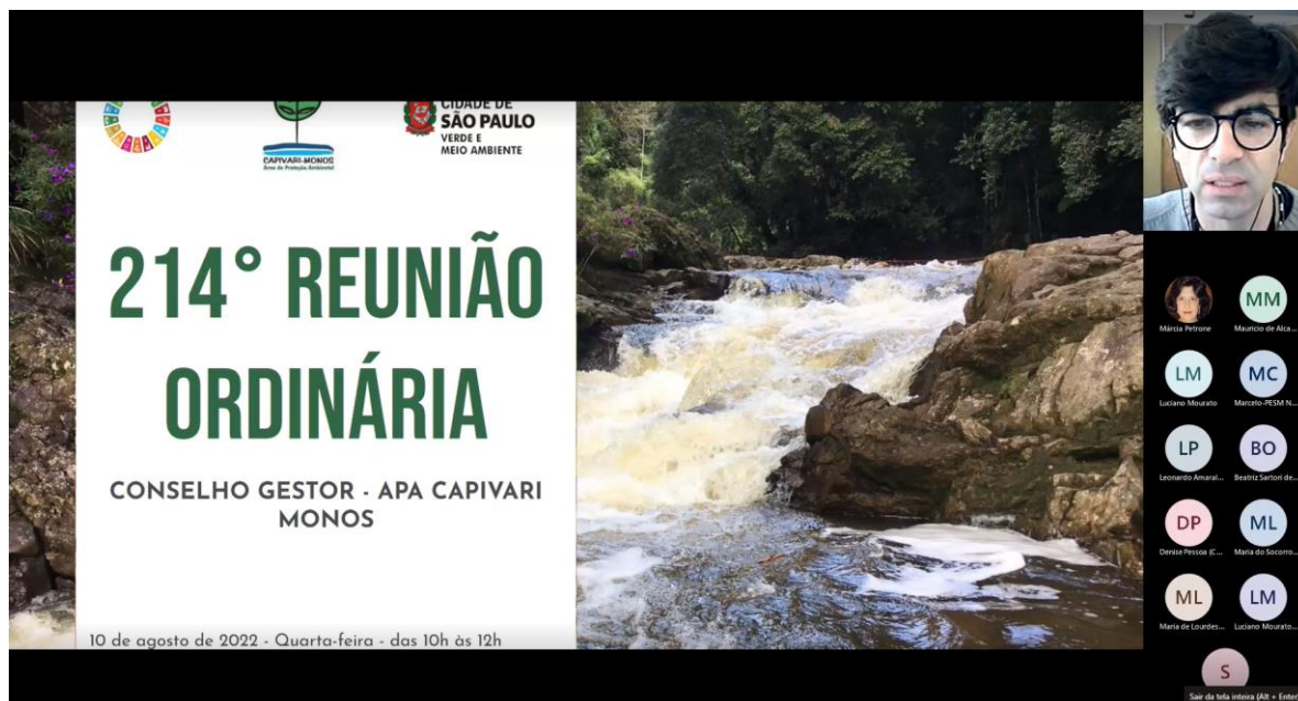
Início da reunião.