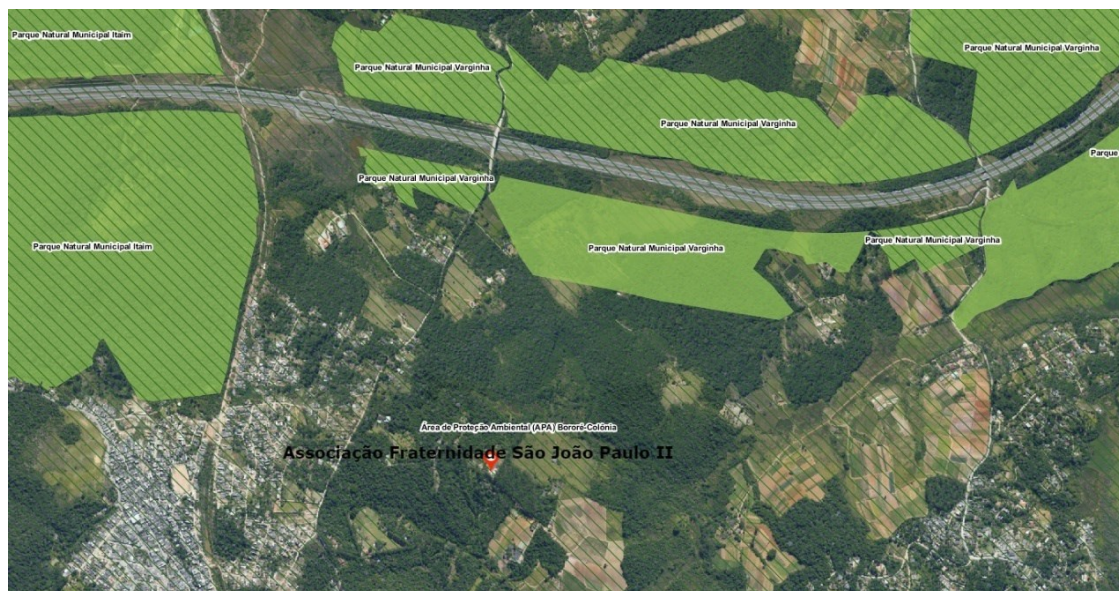
Figura 1. Localização da Associação Fraternidade São João Paulo II, no interior da Área de Proteção Ambiental – APA Bororé-Colônia e na vizinhança sul do Parque Natural Municipal – PNM Varginha (Fonte: GEOSAMPA)