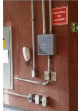
Central de alarmes