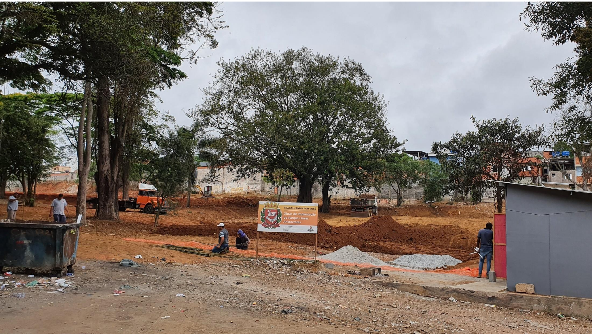
Obras de Implantação em andamento – setembro/2021