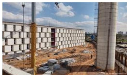
Bloco C – áreas comuns - Foto: set/22.