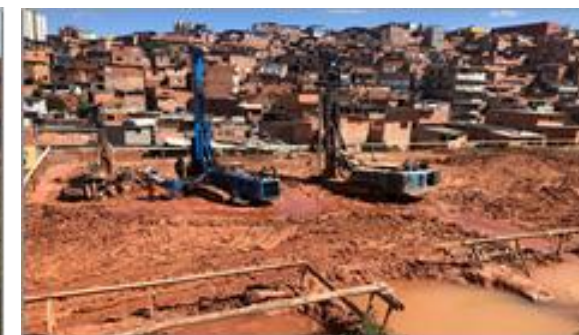
Execução de estaca raiz - Foto: set/22