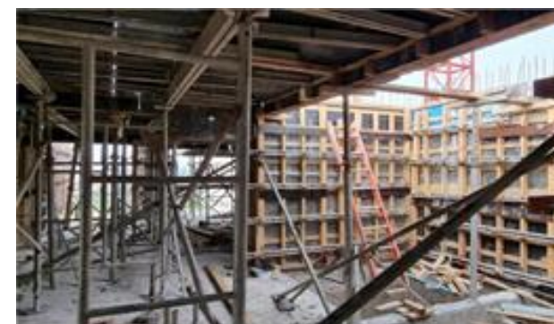
Torre A – Montagem das formas do 16º andar Foto: set/22