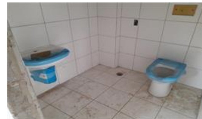
Bloco A – instalação de louças - Foto: set/22.