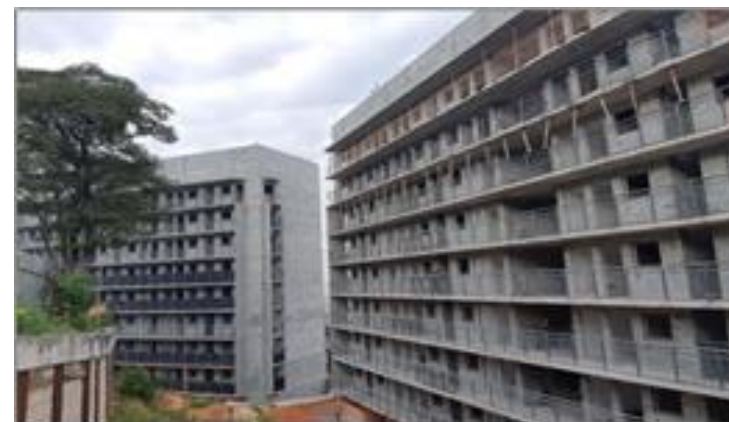
Vistas dos Blocos 1 e 2 - Foto: set/22