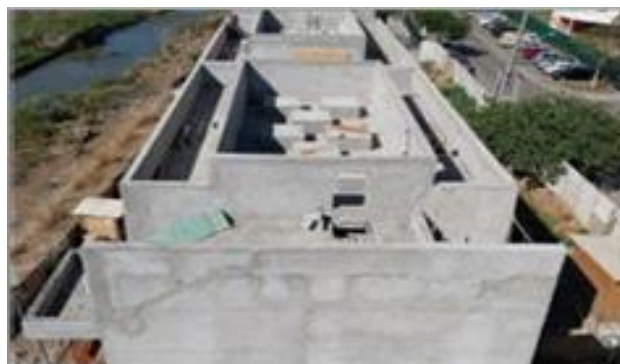
Cond. 3b – vista do bloco 2, 3 e 4.- Foto: set/22.