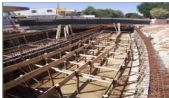
Escoramento de laje do Canal – Trecho 3