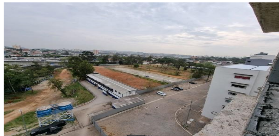
Vista geral área - Foto: set/22.