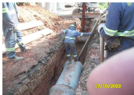
Execução de rede de drenagem – Chácara Florida - Foto: out/22