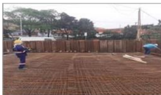
Armação de laje do Canal -Trecho 3