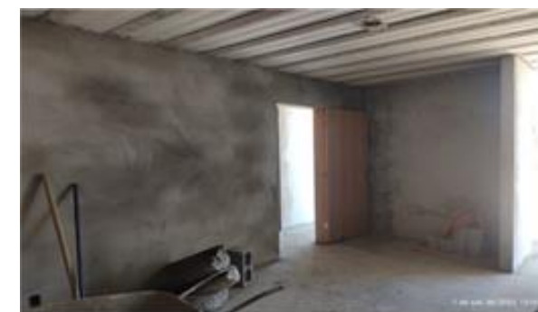
Bloco C – reboco das unidades - Foto: set/22.