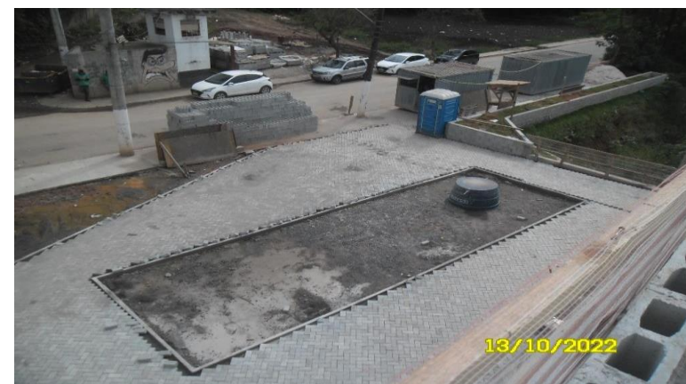
Rua Albergati Capacelli - Assentamento de piso intertravado Jd Tancredo - Foto: out/22