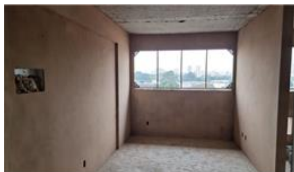
Torre B – Execução do emboço - Foto: set/22