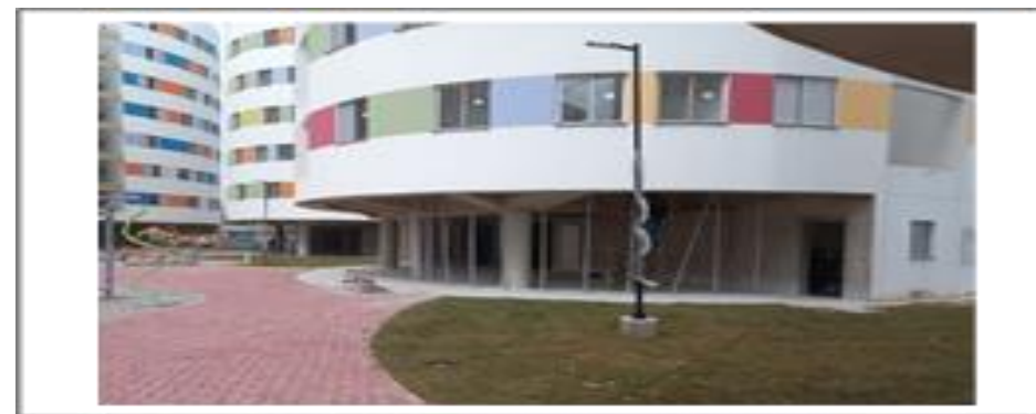
Condomínio 4 – Plantio de grama - Foto: set/22