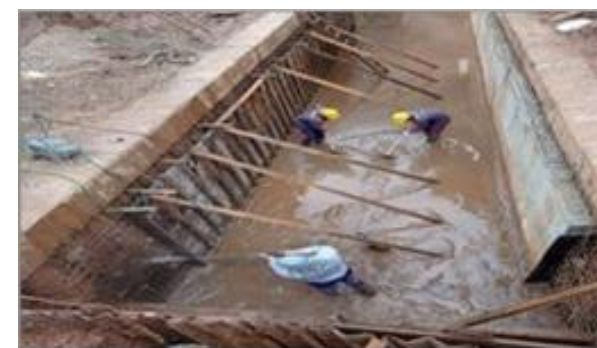
Execução da forma da parede oposta do Canal – Trecho 2º fase - Foto: set/22