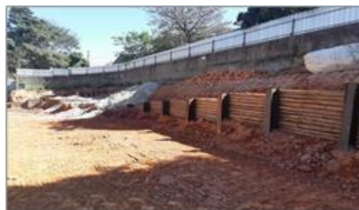
Condomínio 1 – Consolidação Geotécnica – Muro - Foto: set/22