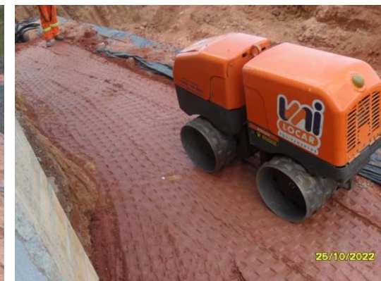
Maria de Barros Teixeira – compactação de aterro GB- 3 - Foto: set/22