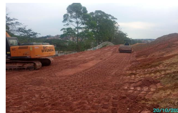
Compactação de camada de aterro – Cavallo Branco – Foto: out/22