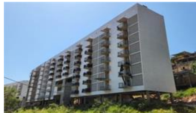
Bloco A – panorâmica – Foto: set/22.