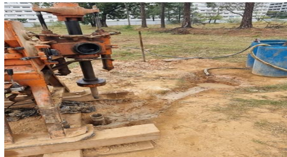
Sondagem rotativa - Foto: set/22