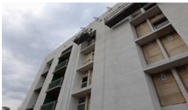
Bloco E – textura projetada na fachada - Foto: set/22.