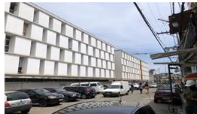
Bloco C – panorâmica - Foto: set/22.