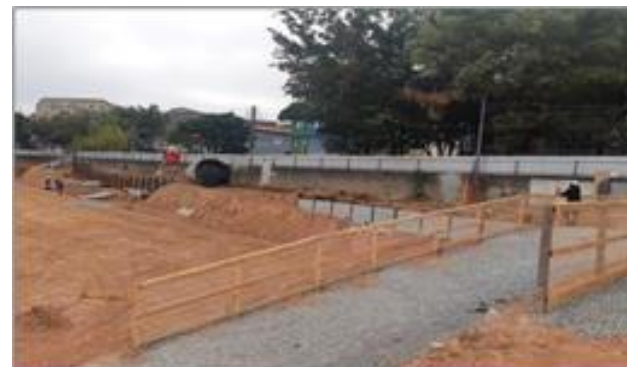
Terraplenagem – Nível do 1º pavimento inferior Foto: set/22