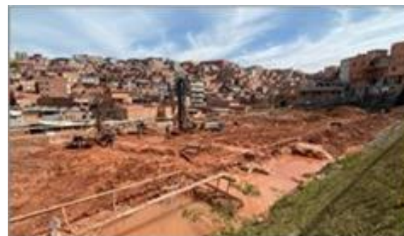
Execução de estaca raiz - Foto: set/22