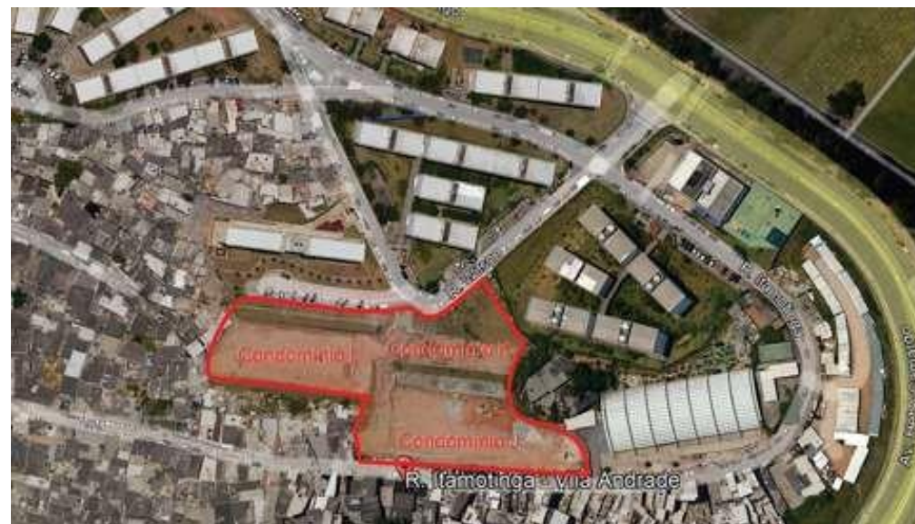
Localização e implantação - Foto: set/22