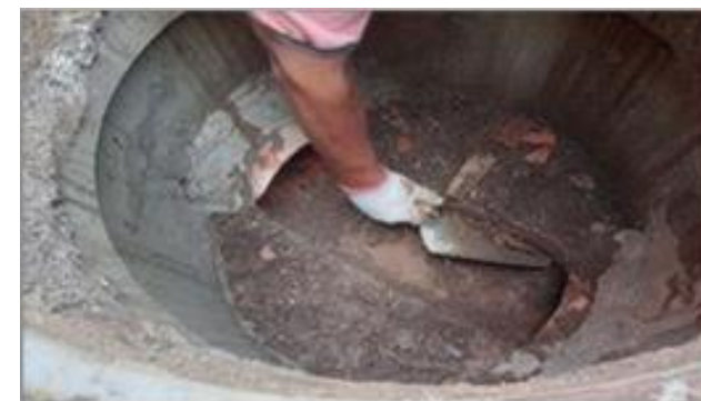
Limpeza da rede de esgoto que atravessa o canteiro de obras - Foto: set/22