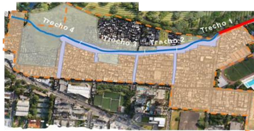
Canalização do córrego - Foto: set/22