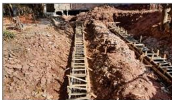
Corta rio – Trecho da 2º fase - Foto: set/22