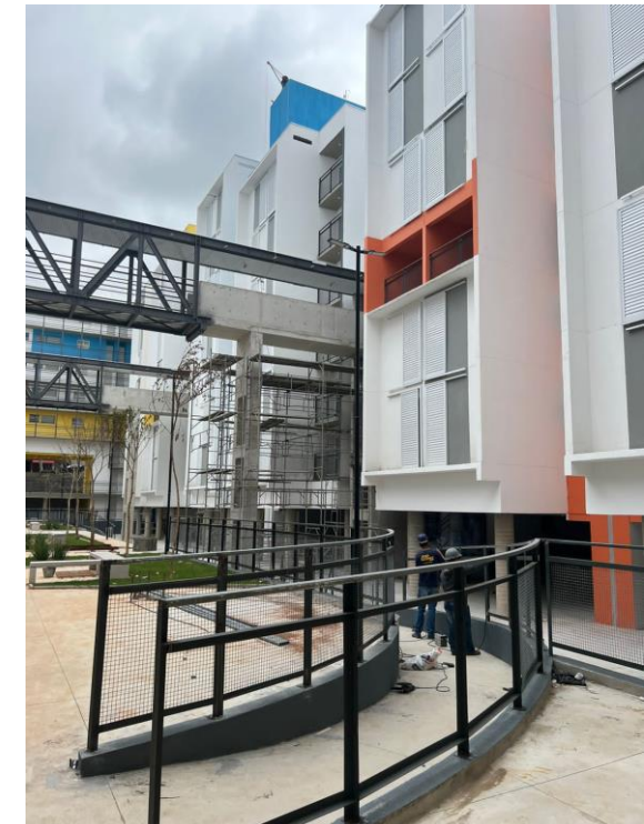
Vista geral áreas comuns - Foto: set/22.