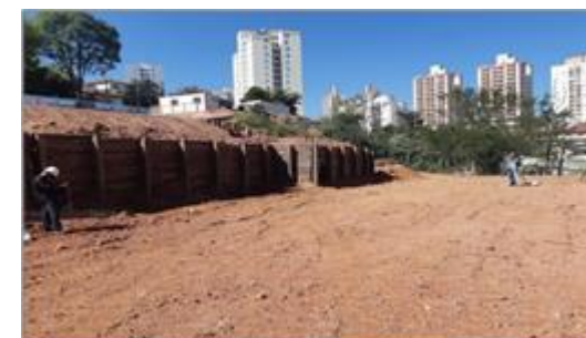
Consolidação Geotécnica - Foto: set/22