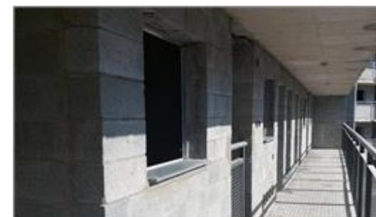
Corredor de acesso aos apartamentos Foto: set/22