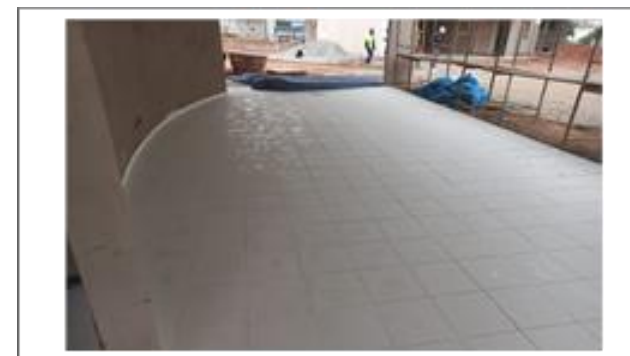
Condomínio 4 – Lazer coberto – piso cerâmico Foto: set/22