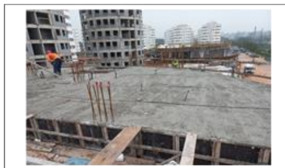
Condomínio 5 – Bloco 7- Concretagem da laje do 3º pavimento - Foto: set/22