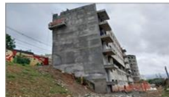
Cond. 3b – vista do bloco 1, 2, 3 e 4 - Foto: set/22.