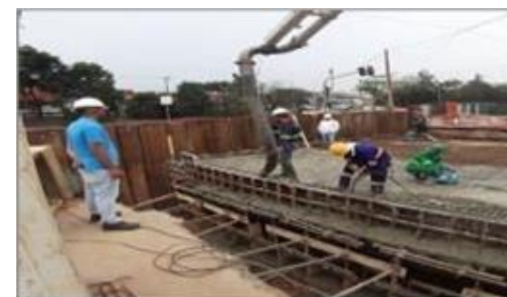
Concretagem de laje do Canal – Trecho 3