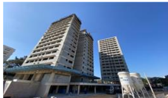
Torre A e B – Panorâmica - Foto: set/22