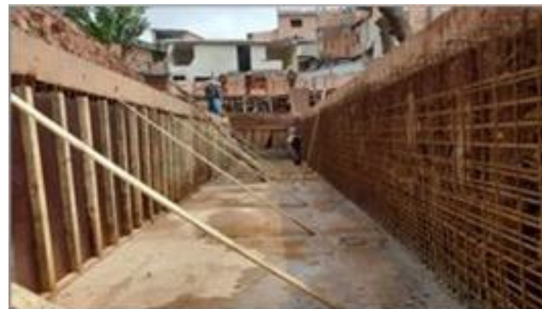
Forma e armação das paredes do Canal – Trecho da 2º fase - Foto: set/22