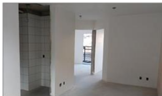
Vista interna do apartamento Foto: set/22