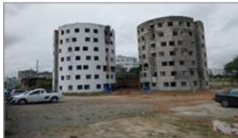
Cond. 4 – vista da área dos blocos 1, 2 e 3 - Foto: set/22.