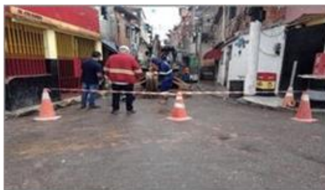
Auxílio a concessionária da Sabesp para o desligamento das moradias que serão demolidas - Foto: set/22