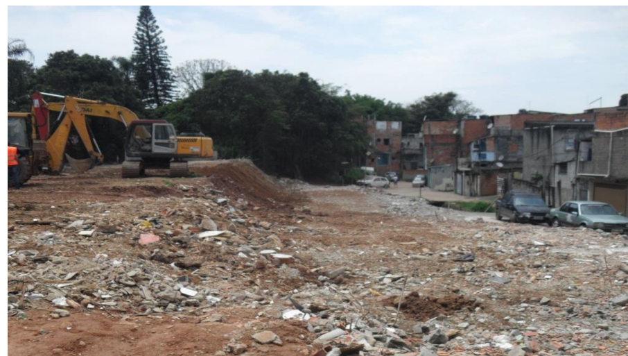
Córrego – remoção do entulho de demolição das casas - Foto: set/22