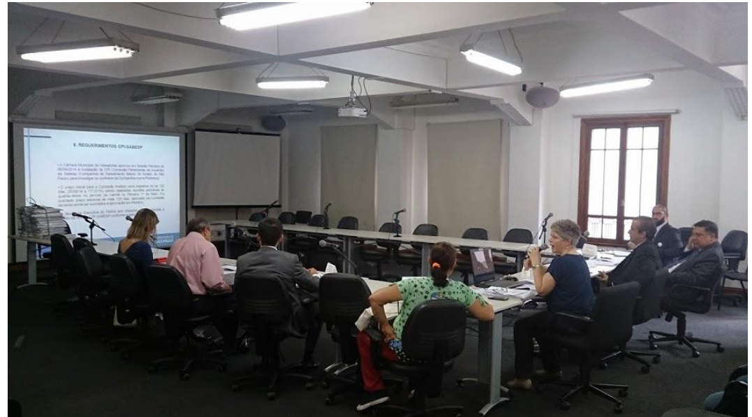
Registro da 7ª Reunião Ordinária

➤ Instalação da 13ª Reunião Extraordinária do Conselho Gestor do FMSAI.