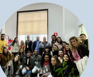
Reunião equipes SGM, SMADS, SMS e SIAT II