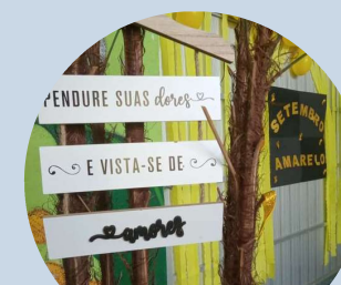
Setembro Amarelo SIAT III Penha