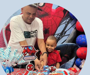
Festa de Aniversário SIAT III Ermelino