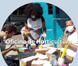
Oficina de Horticultura SIAT II Glicério