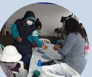
Oficina de Alpargatas SIAT II Armênia