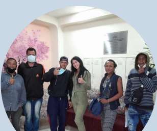
Inserção de beneficiários vindos dos SIAT II para SIAT III Penha e Ermelino Matarazzo