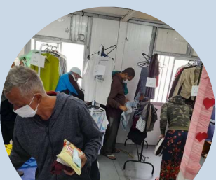
Shopping SIAT SIAT II Armênia