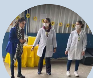
Setembro Amarelo SIAT II Glicério