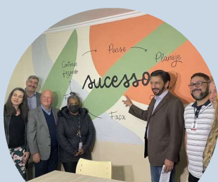
Evento de Inauguração SIAT III Penha