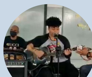
Fórum de Saúde Mental SIAT III Ermelino