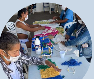
Oficina de Macramê SIAT II Armênia