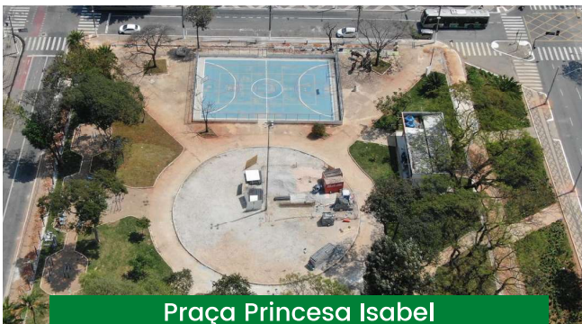
Praça Princesa Isabel