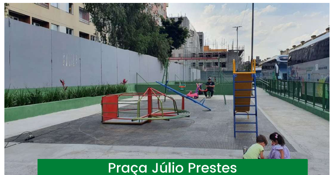
Praça Júlio Prestes