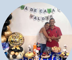
Chá de Casa Nova SIAT III Ermelino