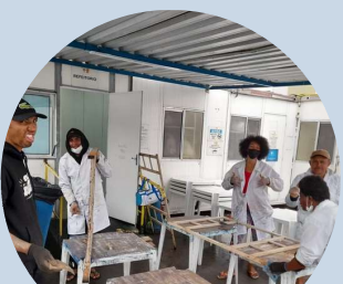
Oficina de Restauração SIAT II Armênia