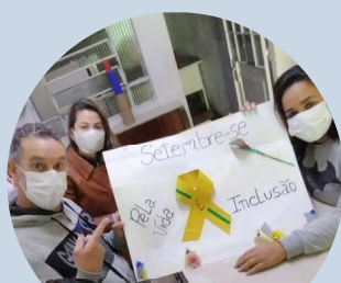
Setembro Amarelo SIAT III Brasilândia