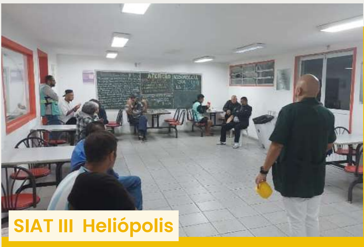
SIAT III Heliópolis

No mês de setembro, alguns equipamentos da Rede Redenção se mobilizaram para realizar oficinas especiais em prevenção ao suicídio. Setembro Amarelo é uma campanha brasileira de prevenção ao suicídio, iniciada em 2015. Desde 2003, o dia 10 de setembro é o Dia Mundial de Prevenção do Suicídio. Confira algumas dinâmicas realizadas!