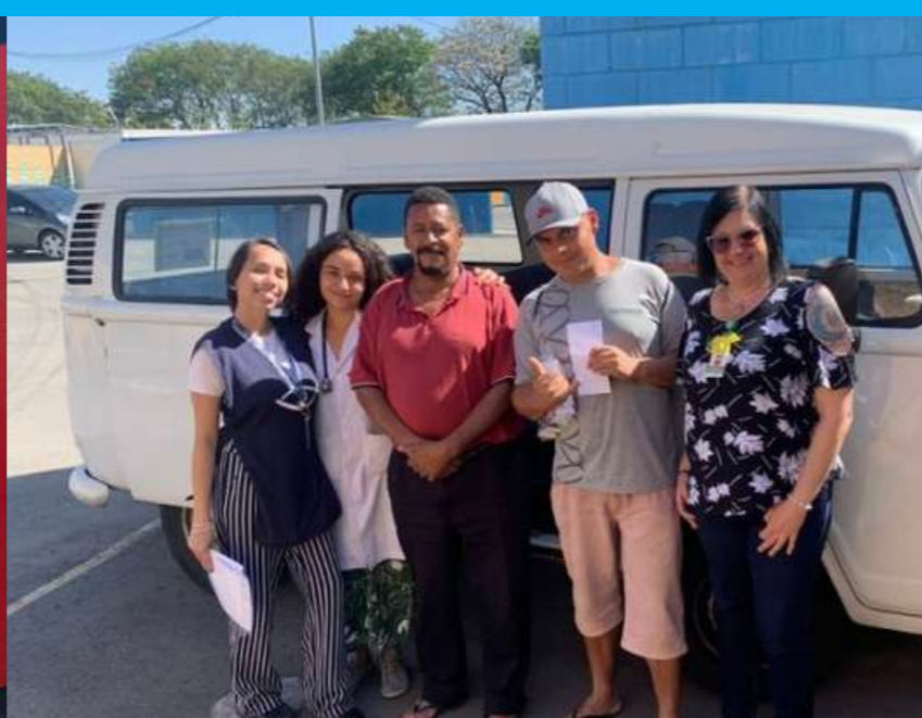
Transferência SIAT III