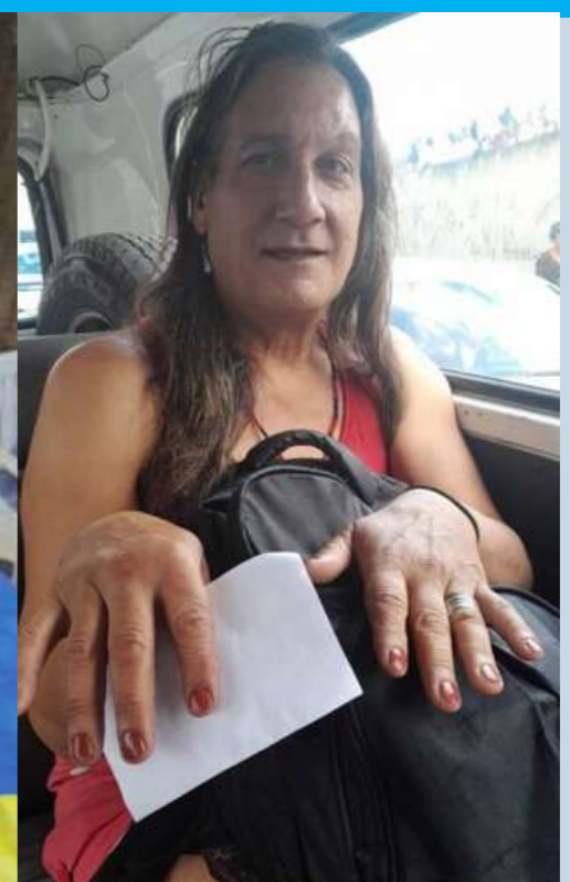
Tratamento de hormônio