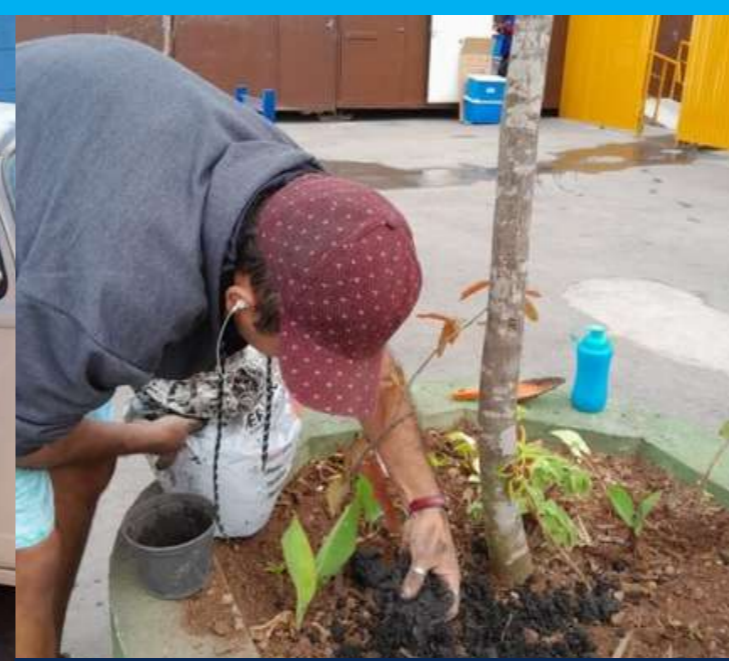
Oficina de jardinagem