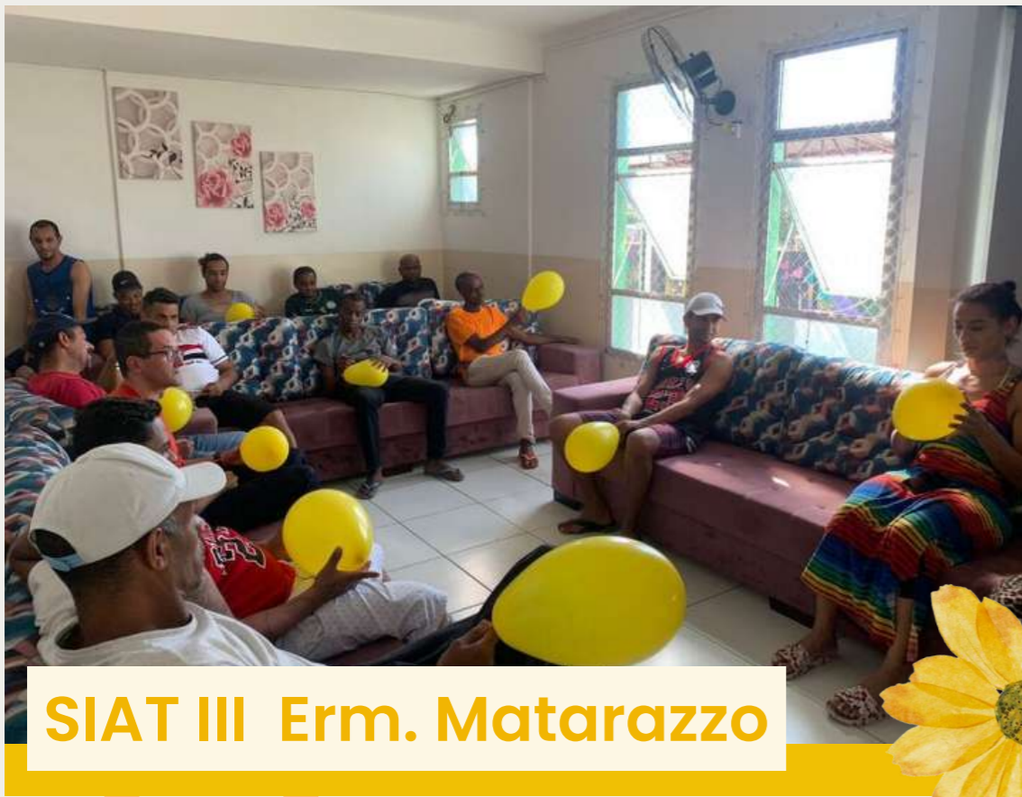
SIAT III Erm. Matarazzo

No mês de setembro, alguns equipamentos da Rede Redenção se mobilizaram para realizar oficinas especiais em prevenção ao suicídio. Setembro Amarelo é uma campanha brasileira de prevenção ao suicídio, iniciada em 2015. Desde 2003, o dia 10 de setembro é o Dia Mundial de Prevenção do Suicídio. Confira algumas dinâmicas realizadas!