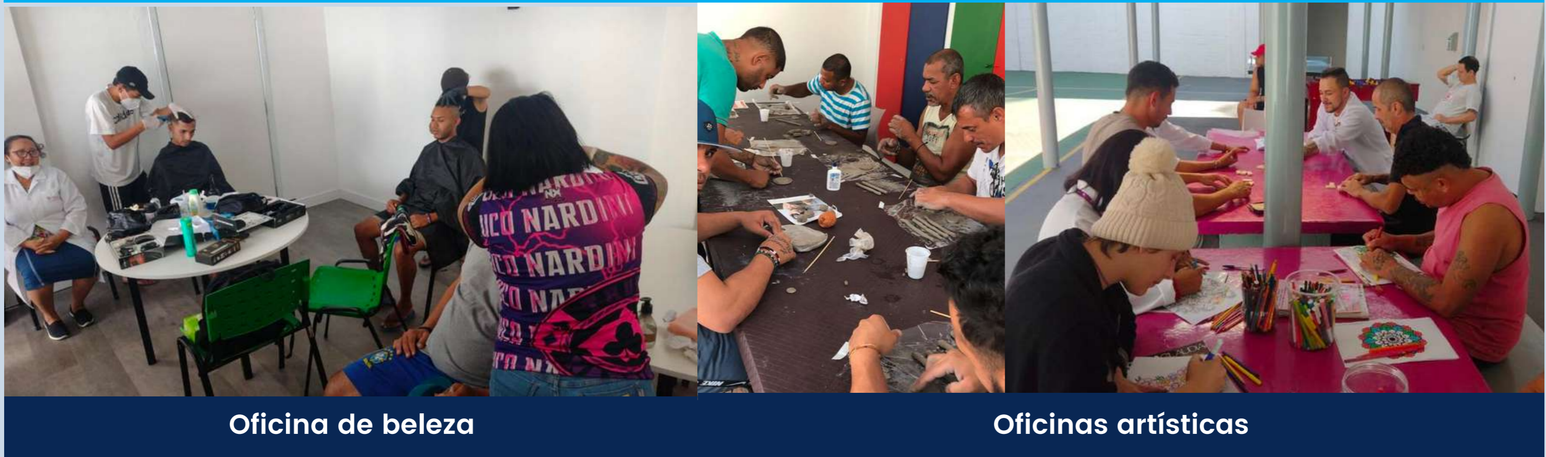
Oficina de beleza