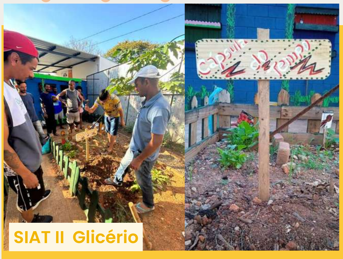
SIAT II Glicério