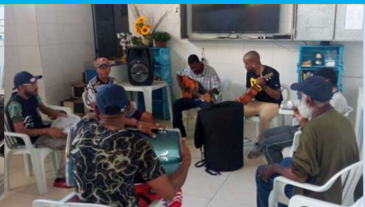
Oficina de percussão