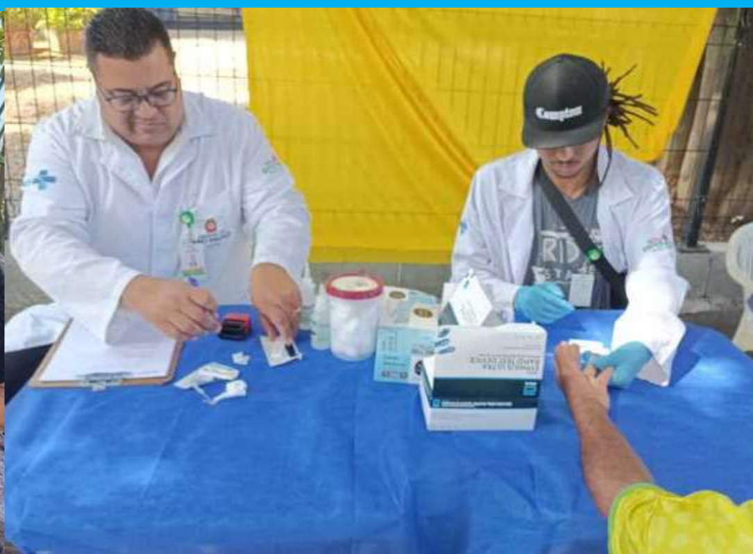
Operação Altas Temperaturas