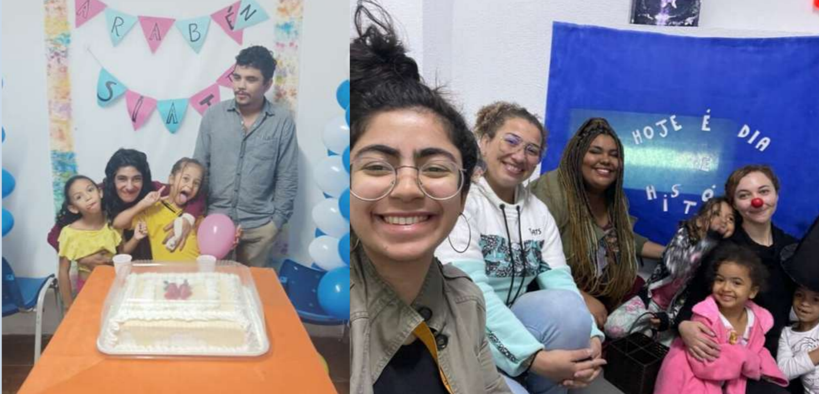
Aniversários do mês