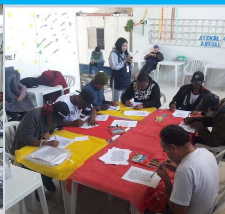
Oficina de mandalas