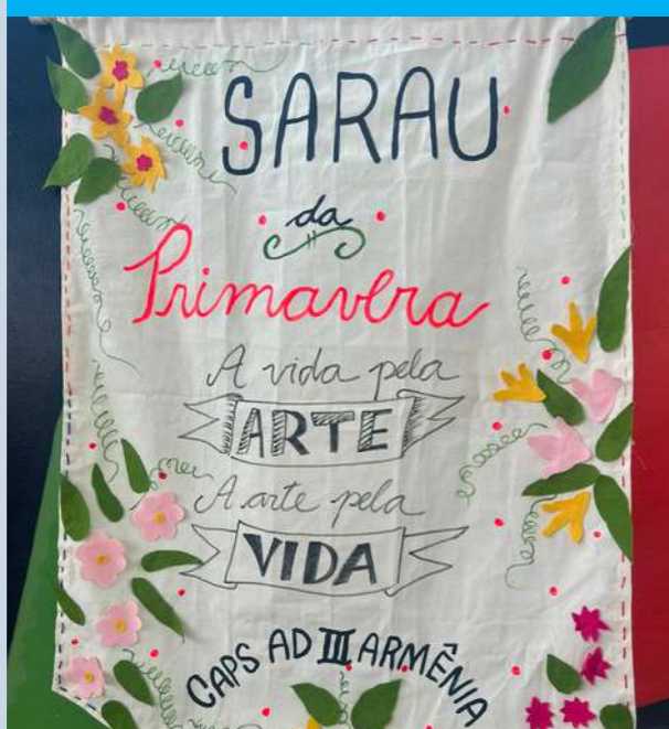
Sarau da Primavera