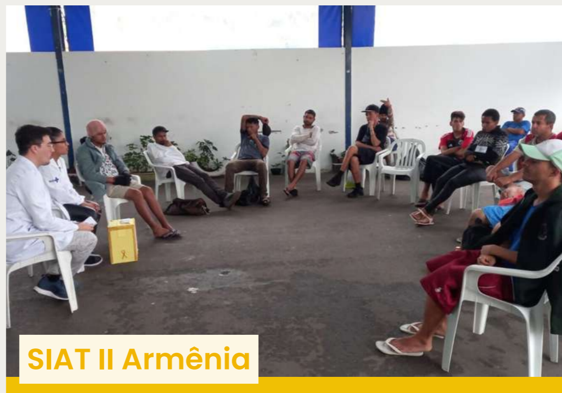
SIAT II Armênia