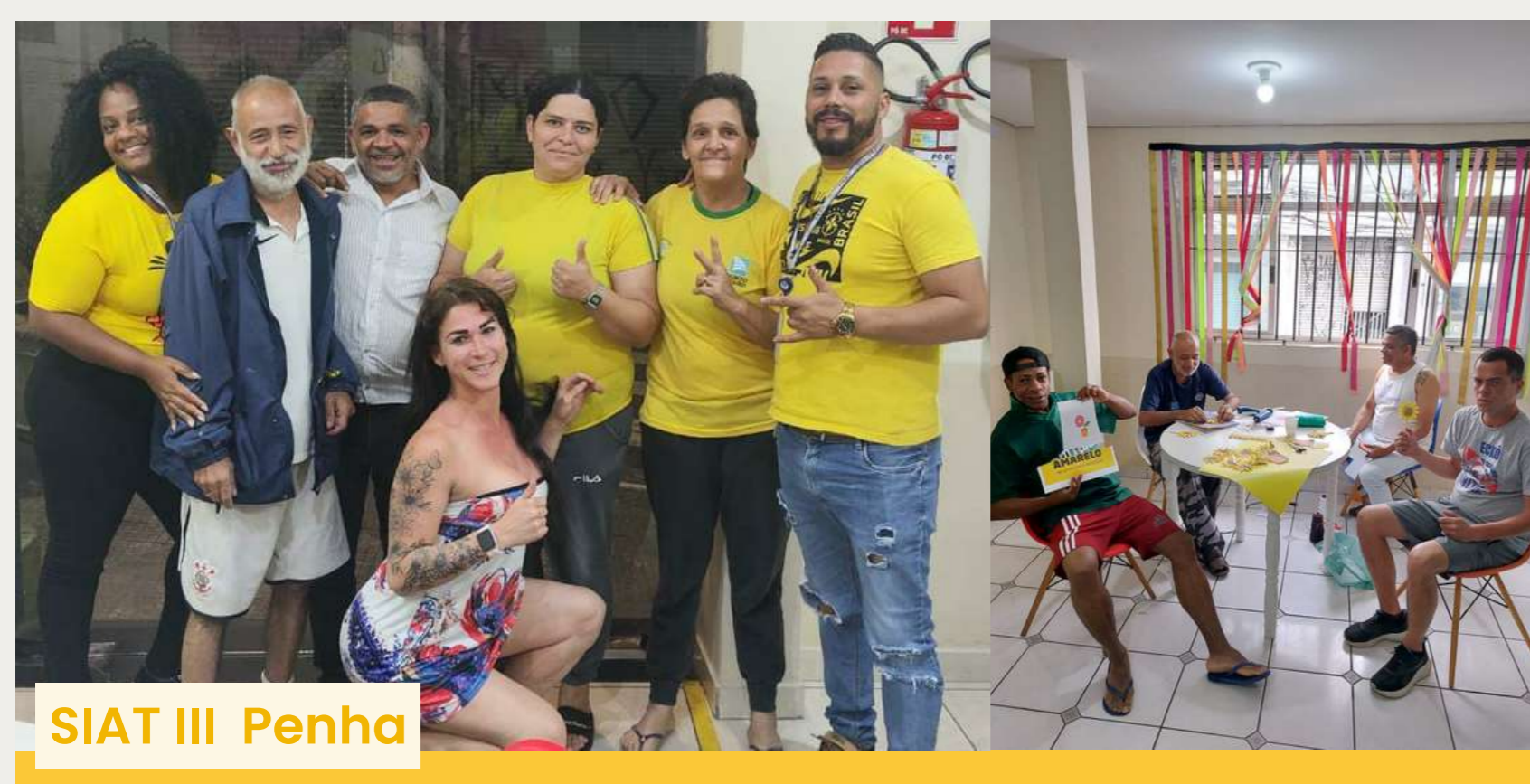
SIAT III Penha