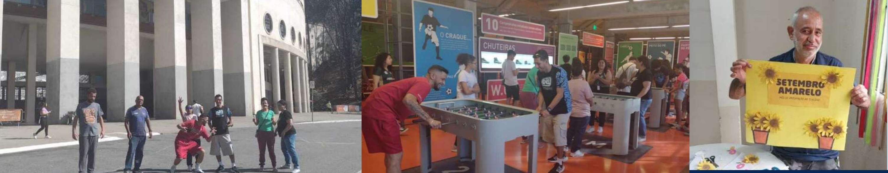
Visita ao Museu do Futebol