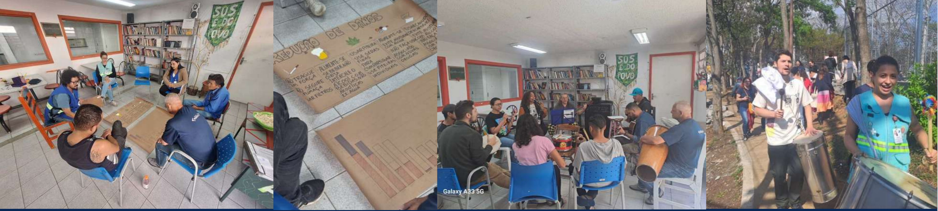
Oficina de redução de danos