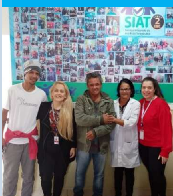
Transferência para o SIAT III