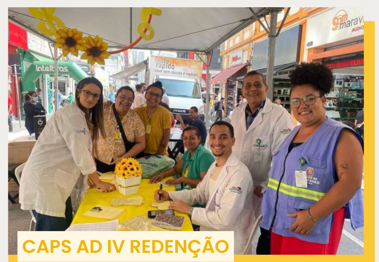
CAPS AD IV REDENÇÃO