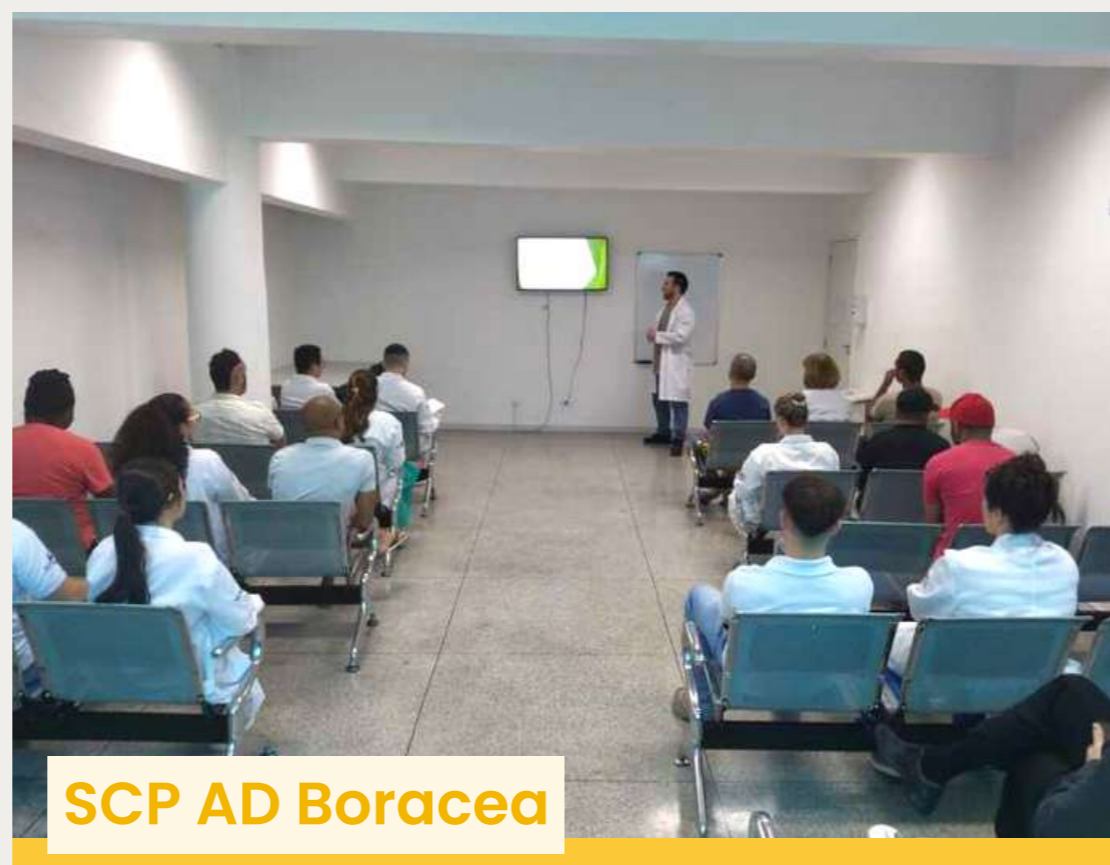
SCP AD Boraceia