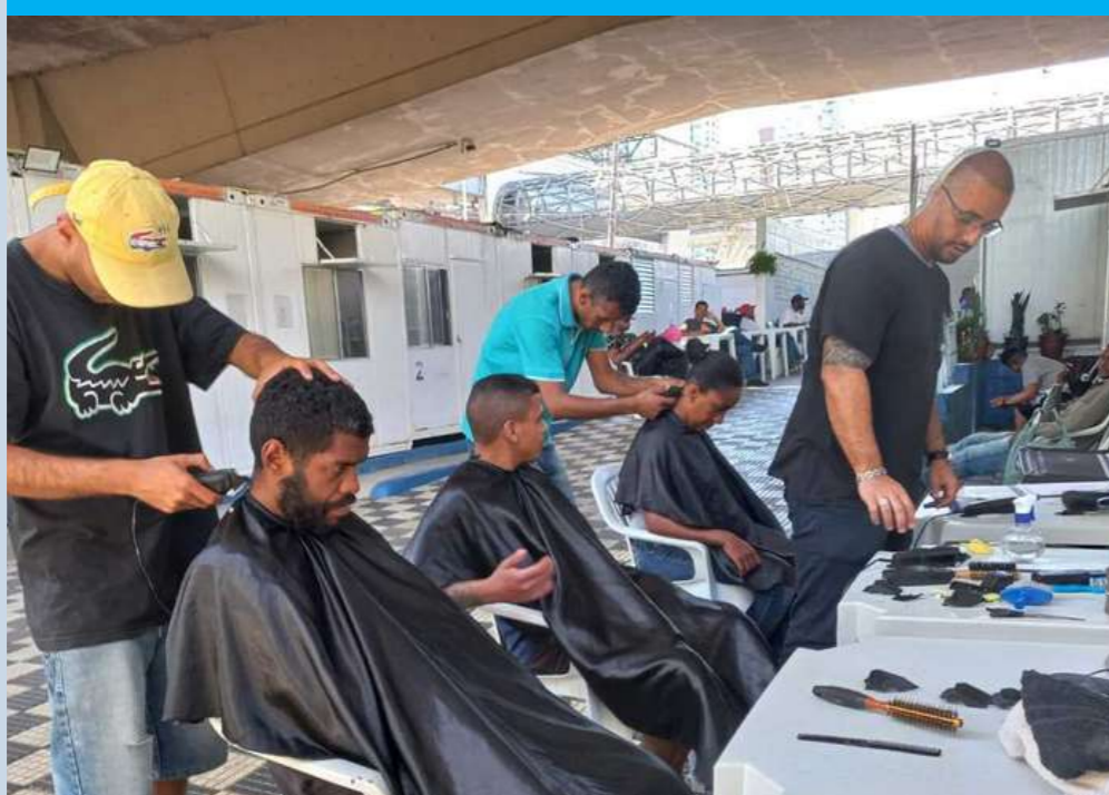
Oficina de barbearia e dia de beleza