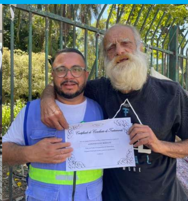
Tratamento de tuberculose