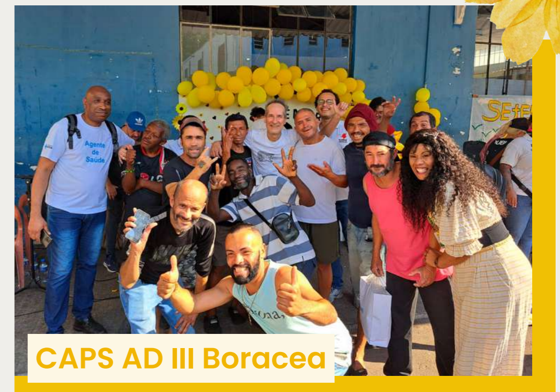
CAPS AD III Boraceia