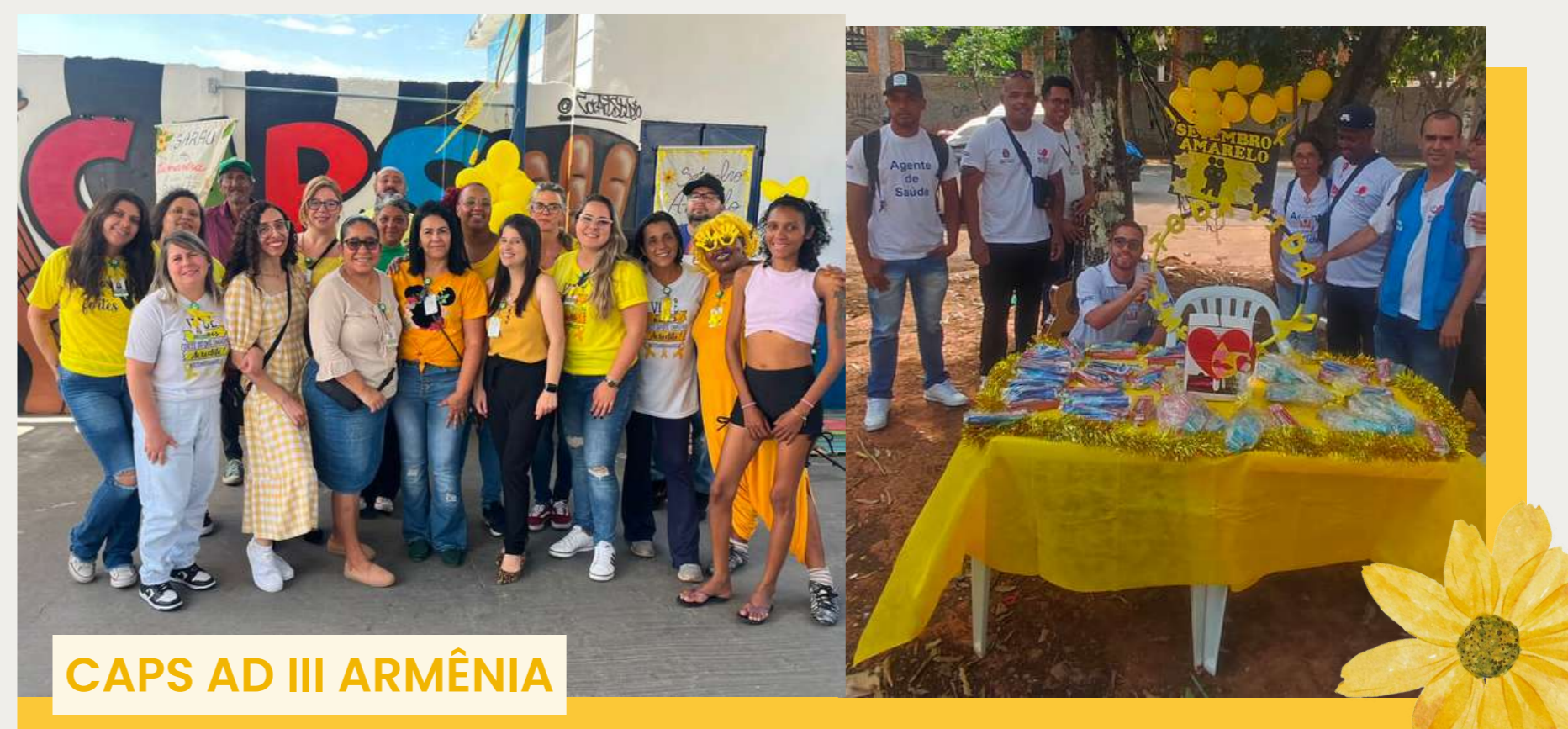
CAPS AD III ARMÊNIA