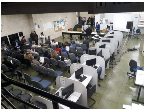
Figura 2 - Audiência Pública na Subprefeitura da Cidade Ademar em 15/07/2019.