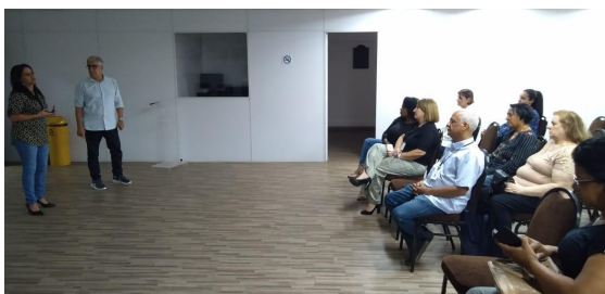
Figura 8 - Audiência Pública na Subprefeitura de Guaianases em 09/01/2020.