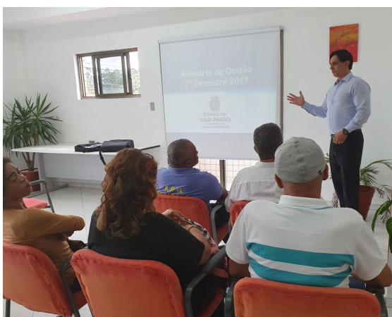
Figura 5 - Audiência Pública na Subprefeitura de Jaçanã/Tremembé em 18/12/2019.

As figuras 5 a 8 abaixo ilustram o momento das Audiências em 4 das Subprefeituras.