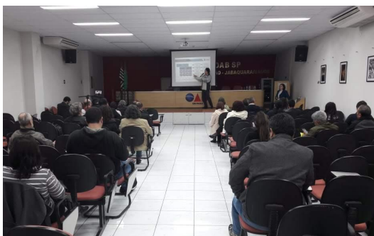
Figura 4 - Audiência Pública na Subprefeitura do Butantã em 16/07/2019.