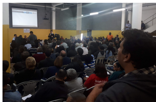
Figura 3 - Audiência Pública na Subprefeitura Vila Mariana em 18/07/2019.