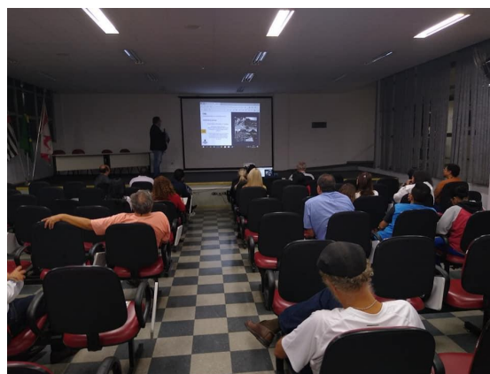
Figura 7 - Audiência Pública na Subprefeitura de Santo Amaro em 19/12/2019.