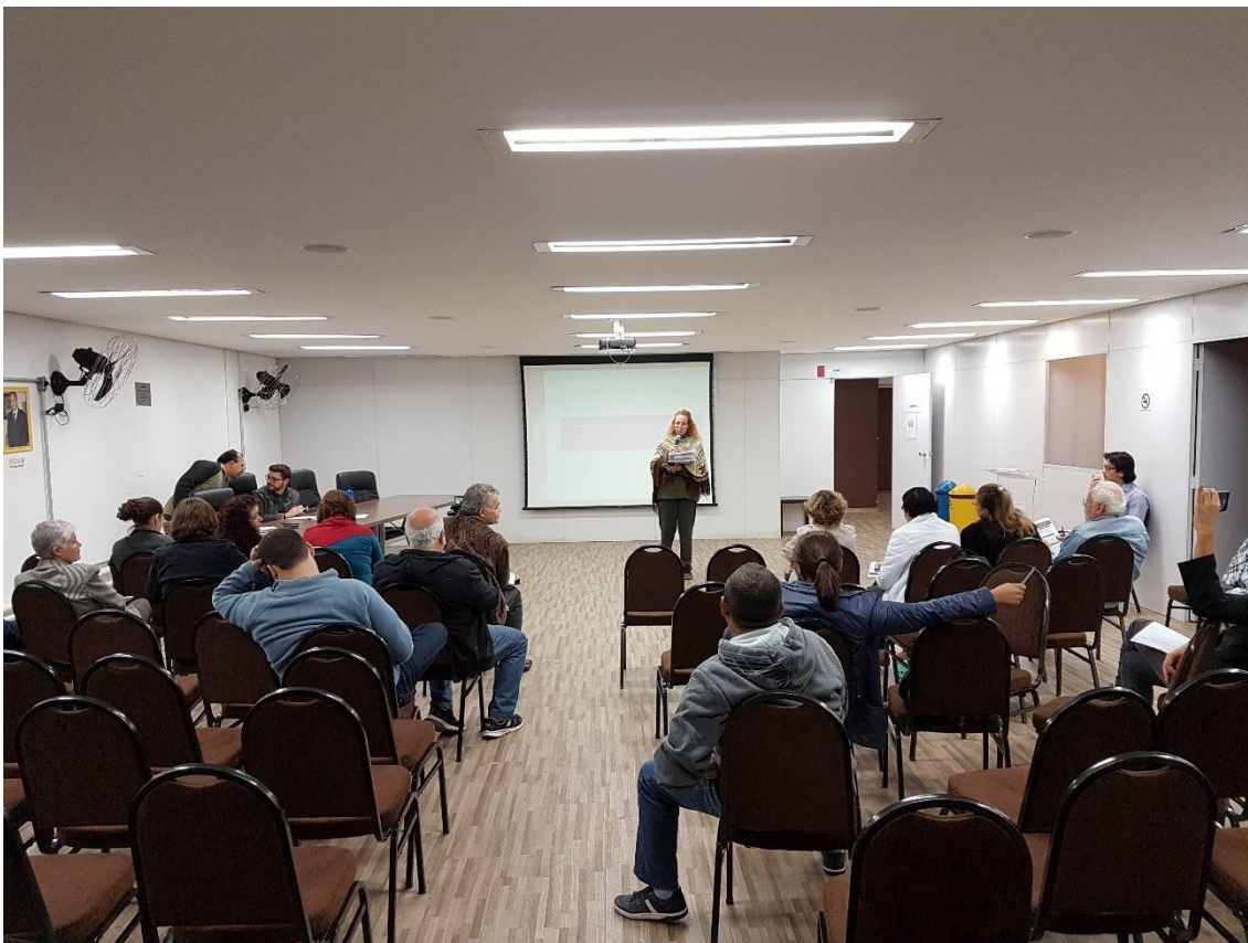
Prefeitura Regional Parelheiros – 11/07/2017