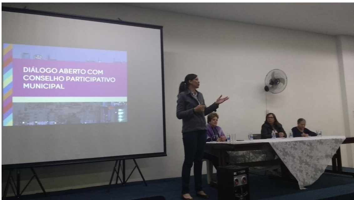
Prefeitura Regional Santana – 13/07/2017