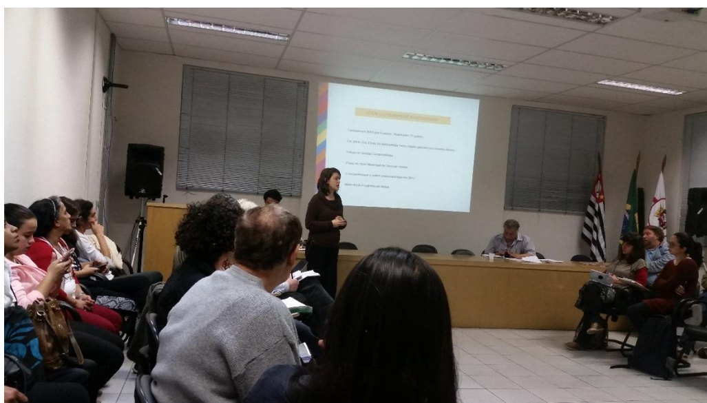
Prefeitura Regional Butantã – 03/08/2017