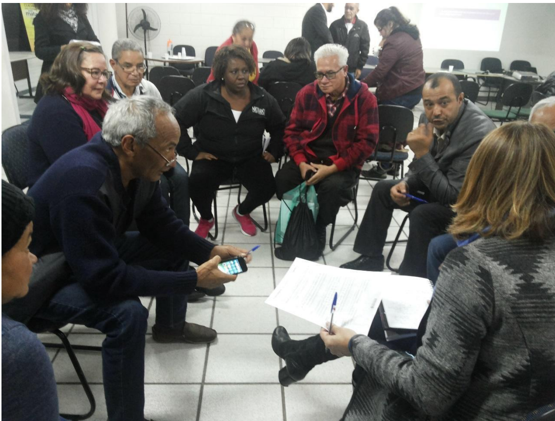
Prefeitura Regional São Mateus – 04/07/2017