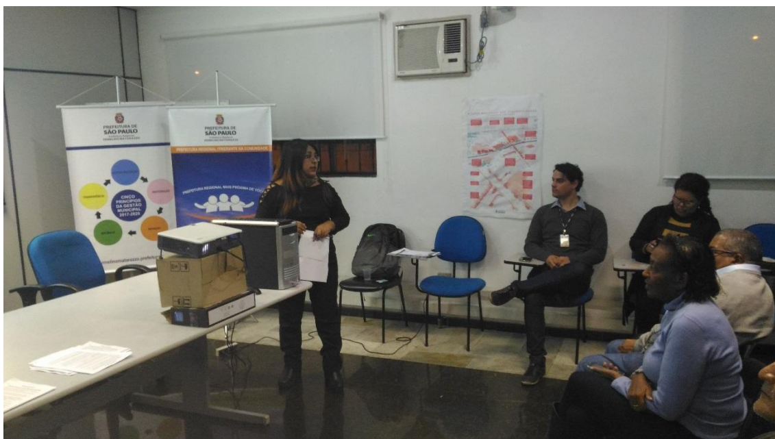
Prefeitura Regional Ermelino Matarazzo – 20/07/2017