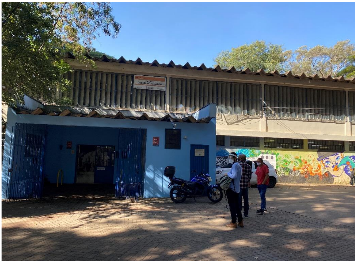
Figura 3 – Fachada da Biblioteca Cassiano Ricardo