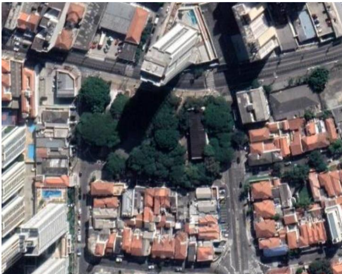
Figura 1 – Localização da Biblioteca Cassiano Ricardo