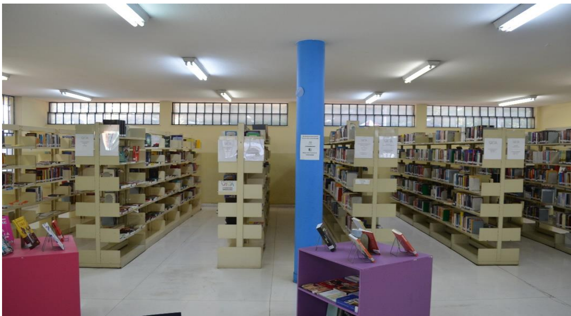
Figura 5 – Área interna da Biblioteca Cassiano Ricardo