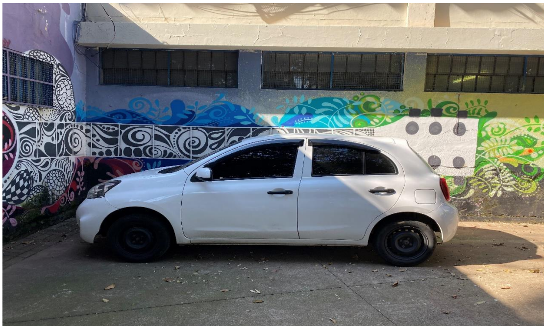
Figura 7 – ÁREA DA PERMISSÃO 29