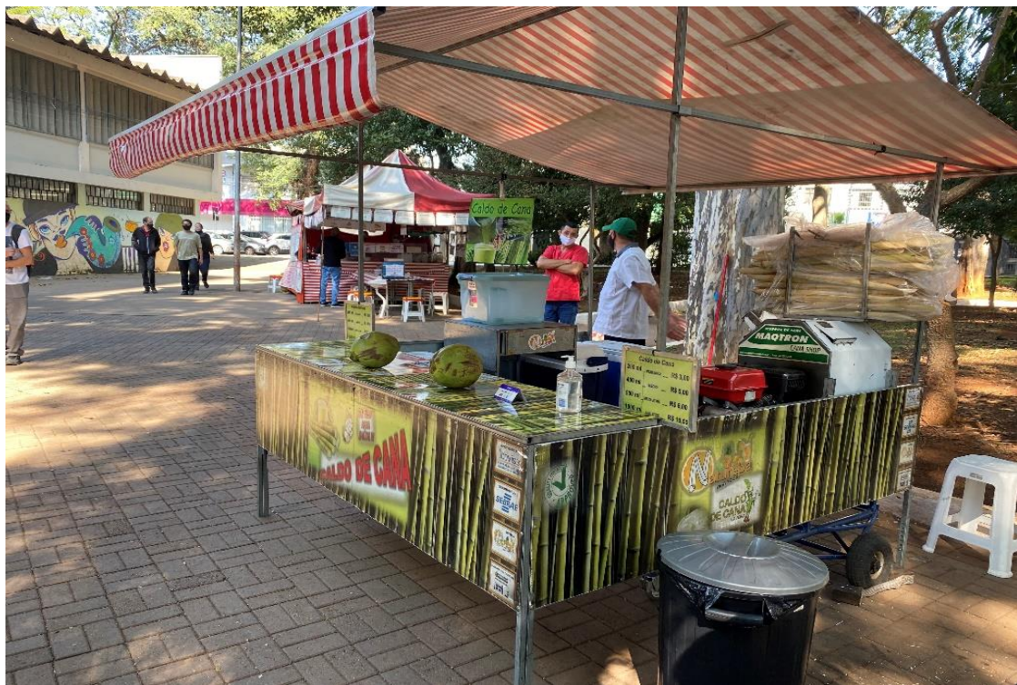
Figura 4 - Praça José Moreno, em frente à Biblioteca Cassiano Ricardo