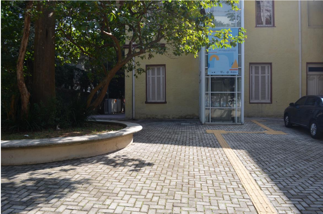
Figura 5 – Espaço externo do Museu Chacara Lane