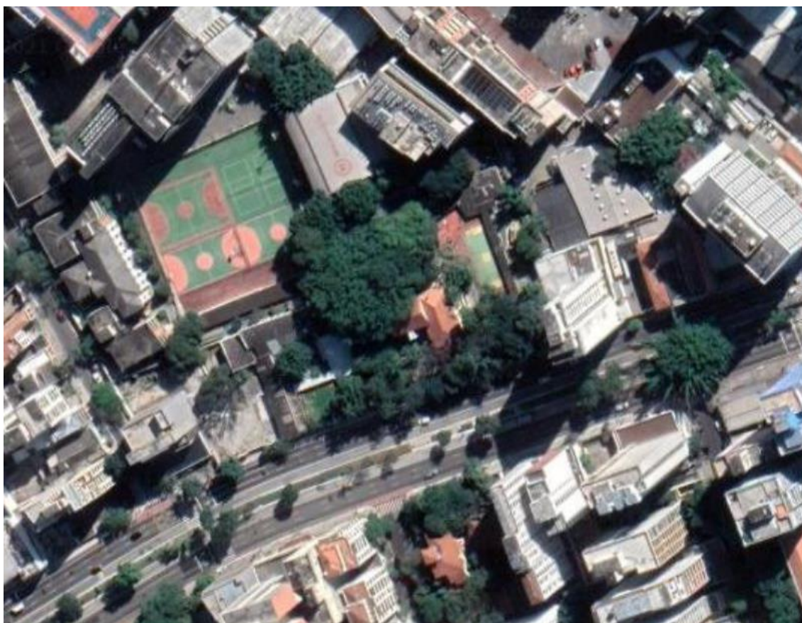
Figura 1 – Localização do Museu Chácara Lane