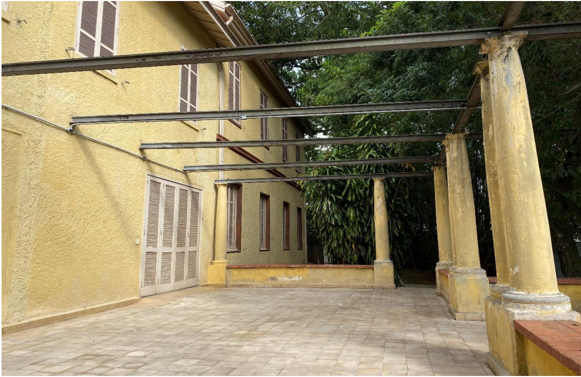
Figura 7– ÁREA DA PERMISSÃO 27