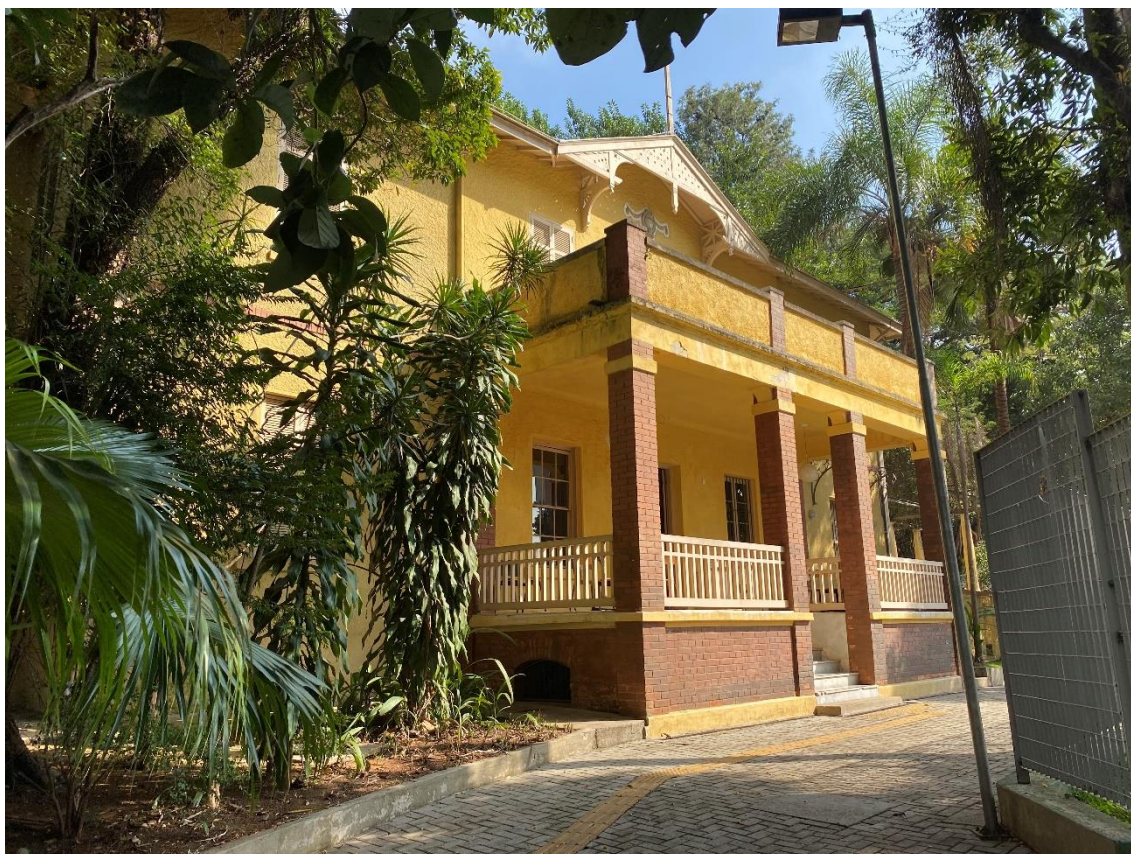
Figura 3– Fachada do Museu Chacara Lane