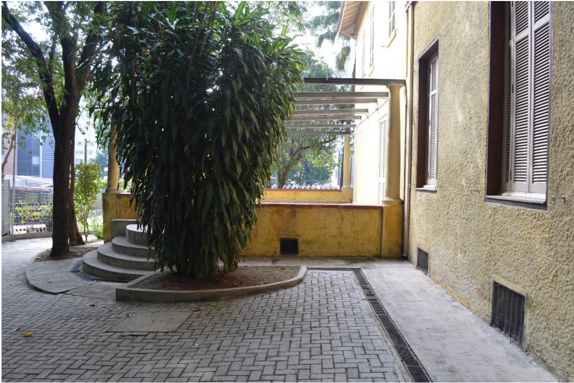
Figura 6 – Espaço externo do Museu Chacara Lane