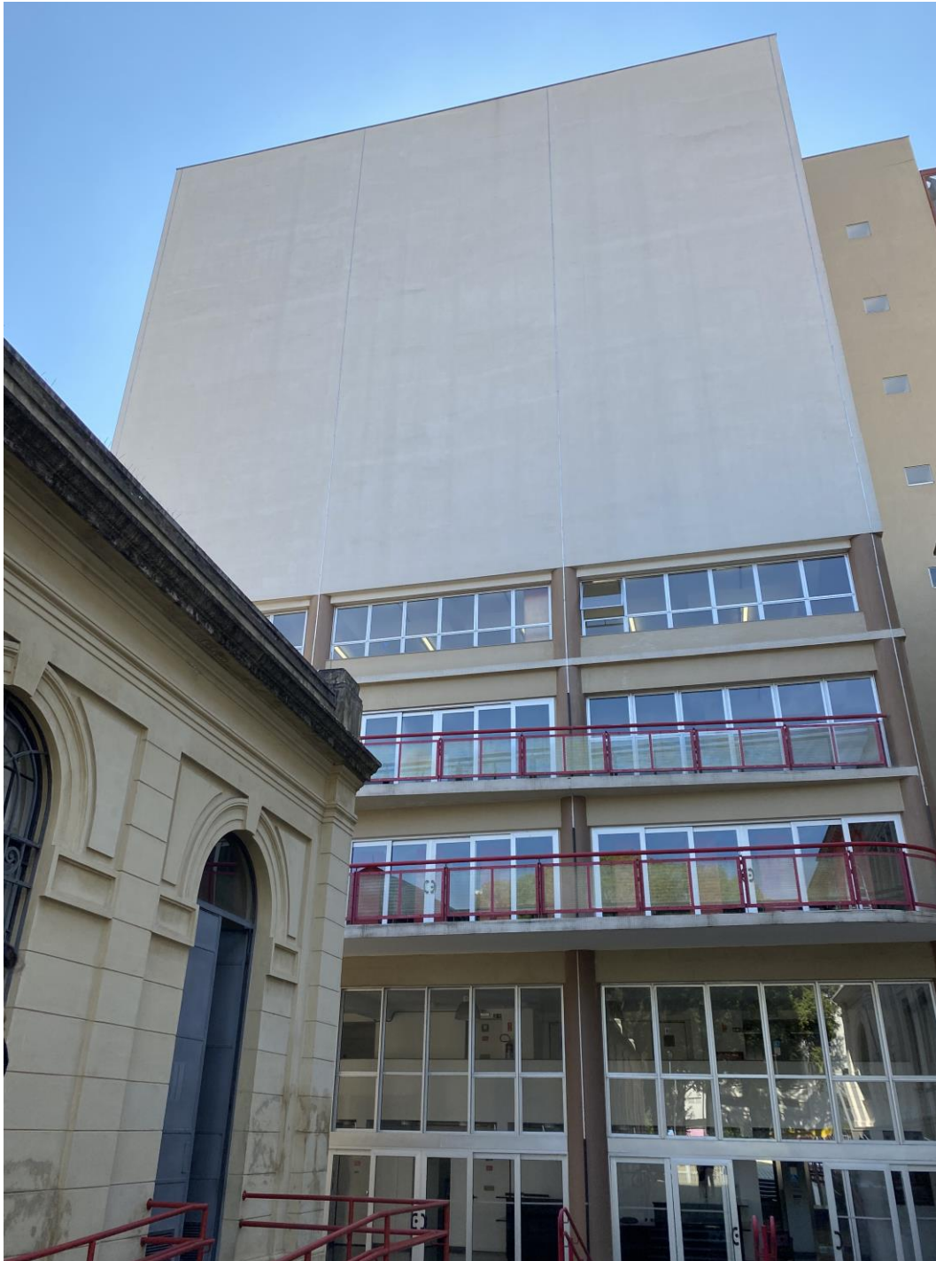
Figura 5 – Fachada do Arquivo Histórico Municipal - Edifício da Memória