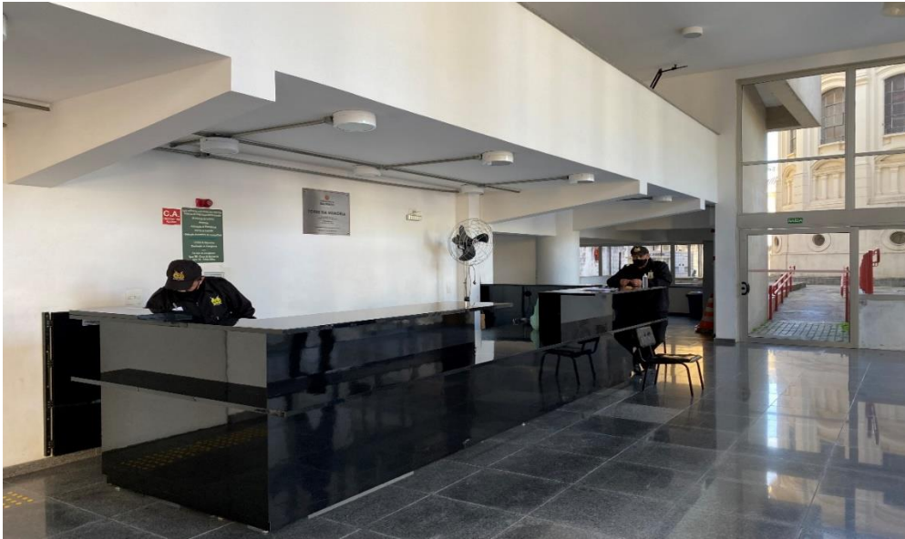
Figura 6 – Área interna do Arquivo Histórico Municipal - Edifício da Memória