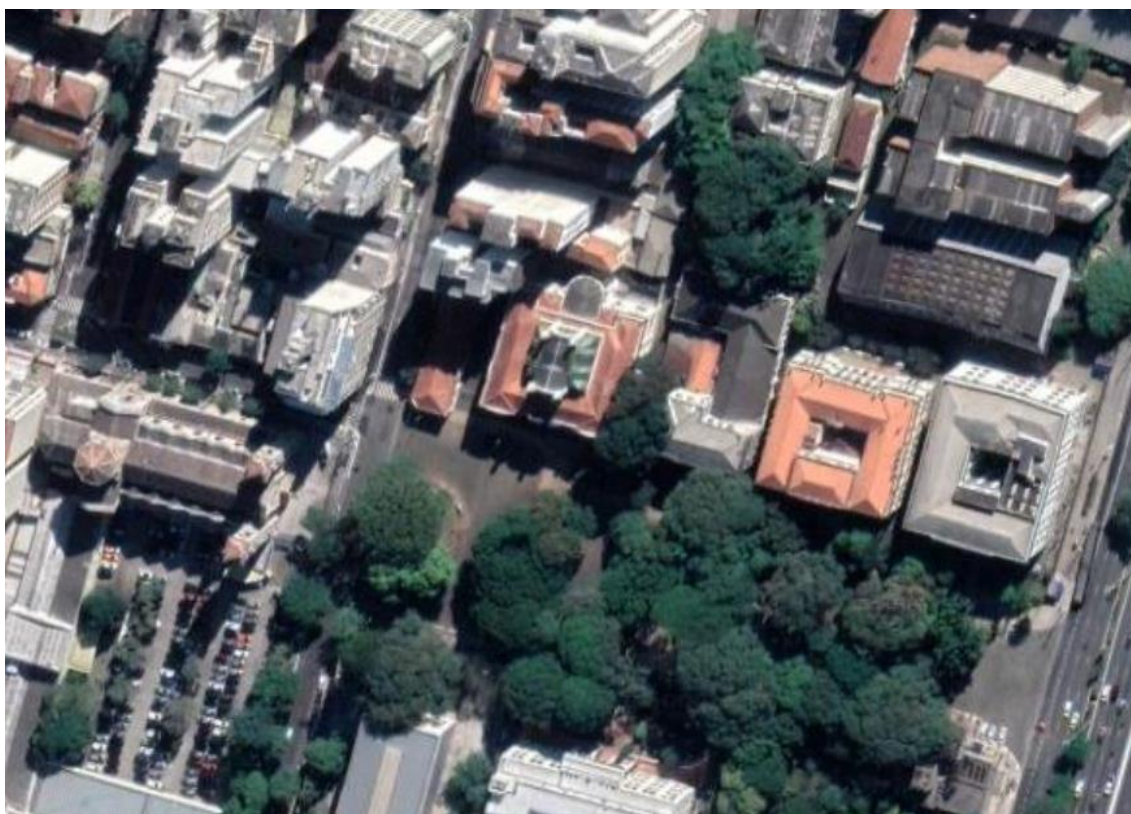
Figura 1 – Localização e volumetria do Arquivo Histórico Municipal

Fonte: Google Maps, 2021. Disponível em: