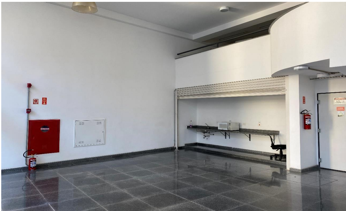
Figura 7 – ÁREA DA PERMISSÃO 26