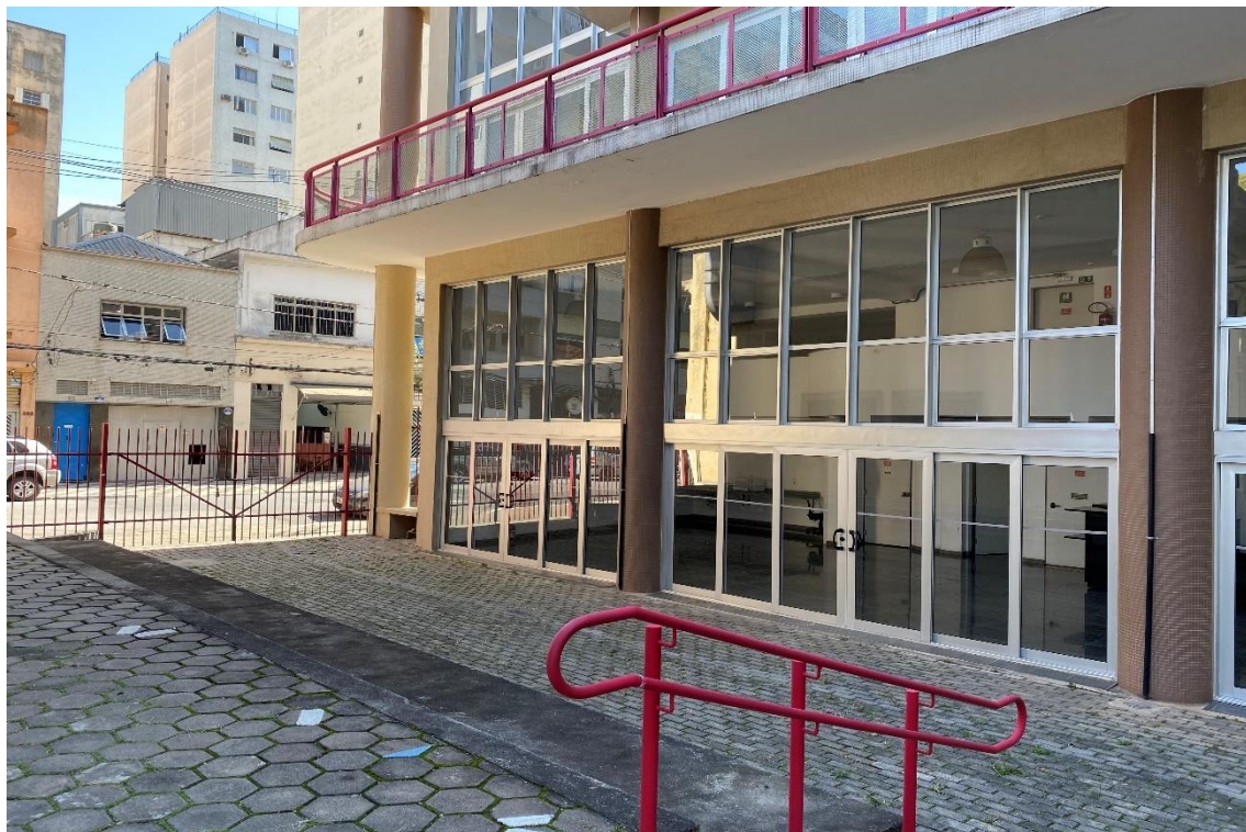
Figura 4 - Área externa do Arquivo Histórico Municipal - Edifício da Memória