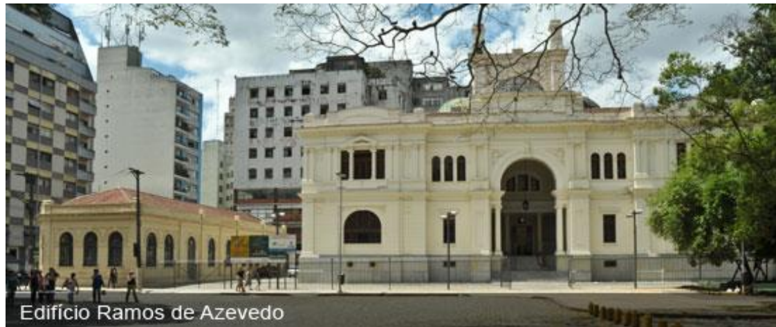
Figura 3 - Fachada do Arquivo Histórico Municipal – Edifício Ramos de Azevedo