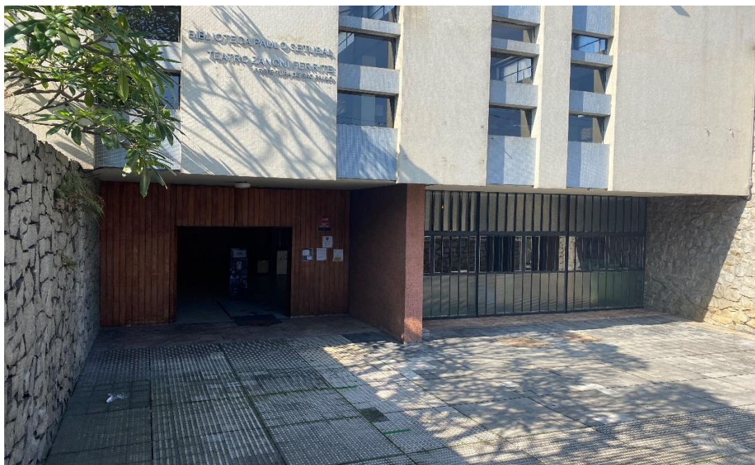
Figura 5 – Fachada do Centro Cultural da Vila Formosa