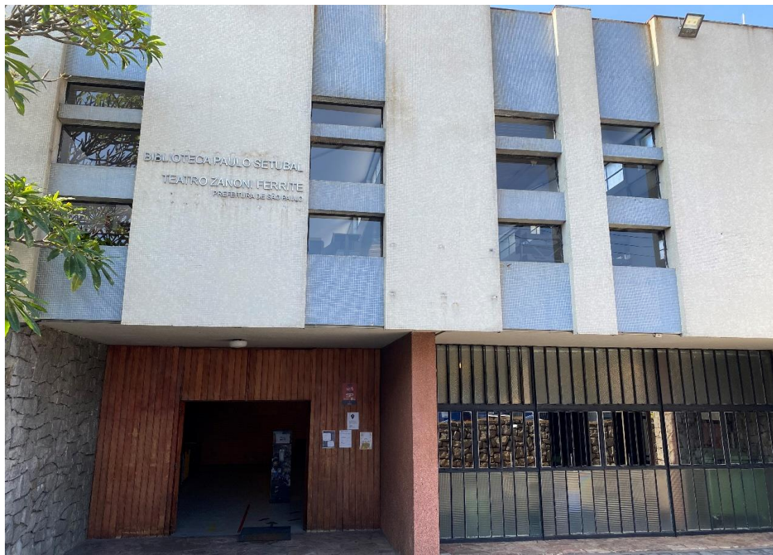
Figura 6 – Fachada do Centro Cultural da Vila Formosa