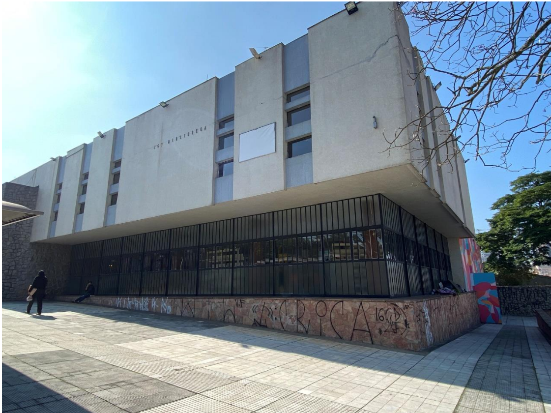
Figura 3 – Fachada do Centro Cultural da Vila Formosa