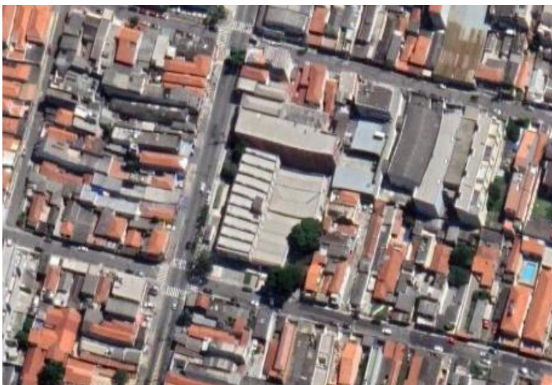
Figura 1 – Localização e volumetria do Centro Cultural da Vila Formosa

A ÁREA DA PERMISSÃO 25 abrange a combinação da ÁREA DE USO OPERACIONAL e da ÁREA DE INFLUÊNCIA. A primeira com 9,58 m 2 , e a segunda com 27,86 m 2 , ambas pertencentes ao térreo do edifício, próximas à entrada do Centro Cultural pela Av. Renata. No caso, a ÁREA DE INFLUÊNCIA se subdivide em: parte da área interna (14,55 m 2 ) e parte da área externa (13,28 m 2 ), junto à praça de entrada do edifício.