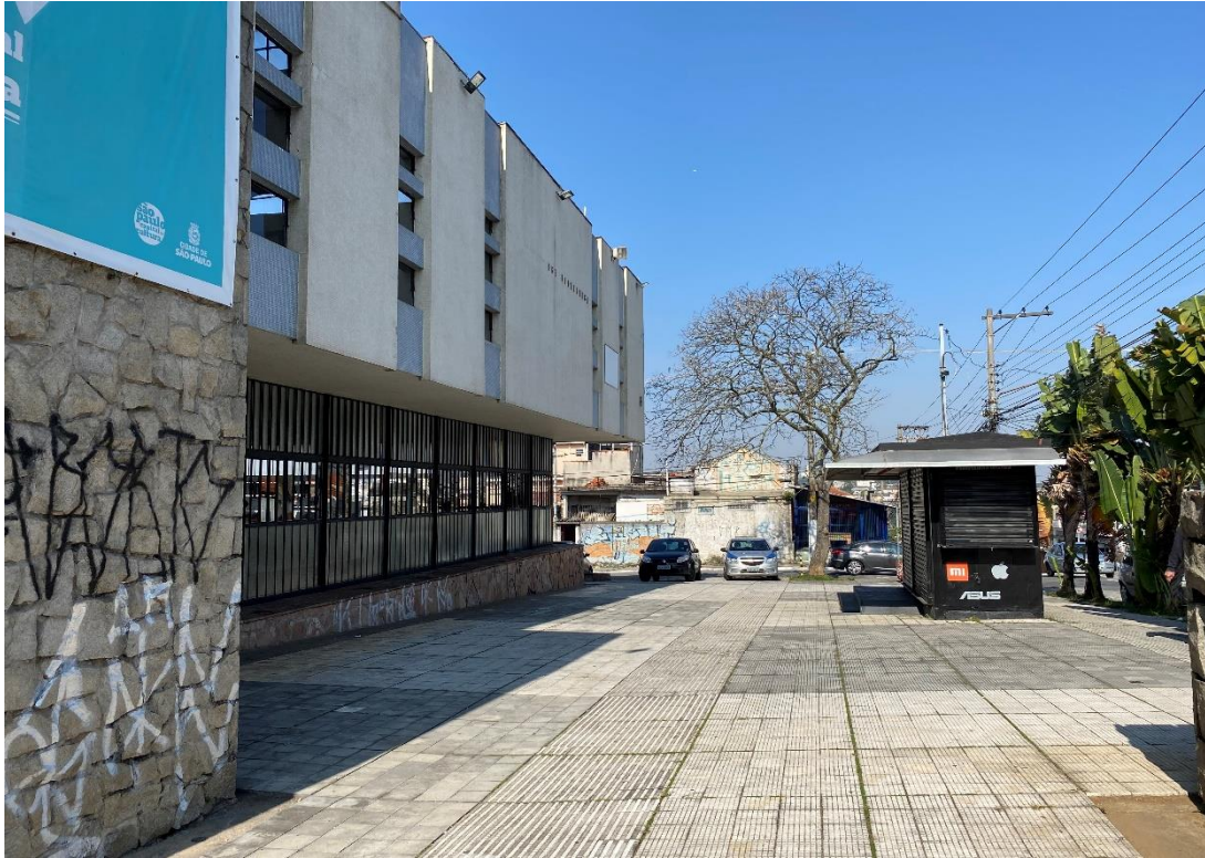
Figura 4 – Área externa do Centro Cultural da Vila Formosa