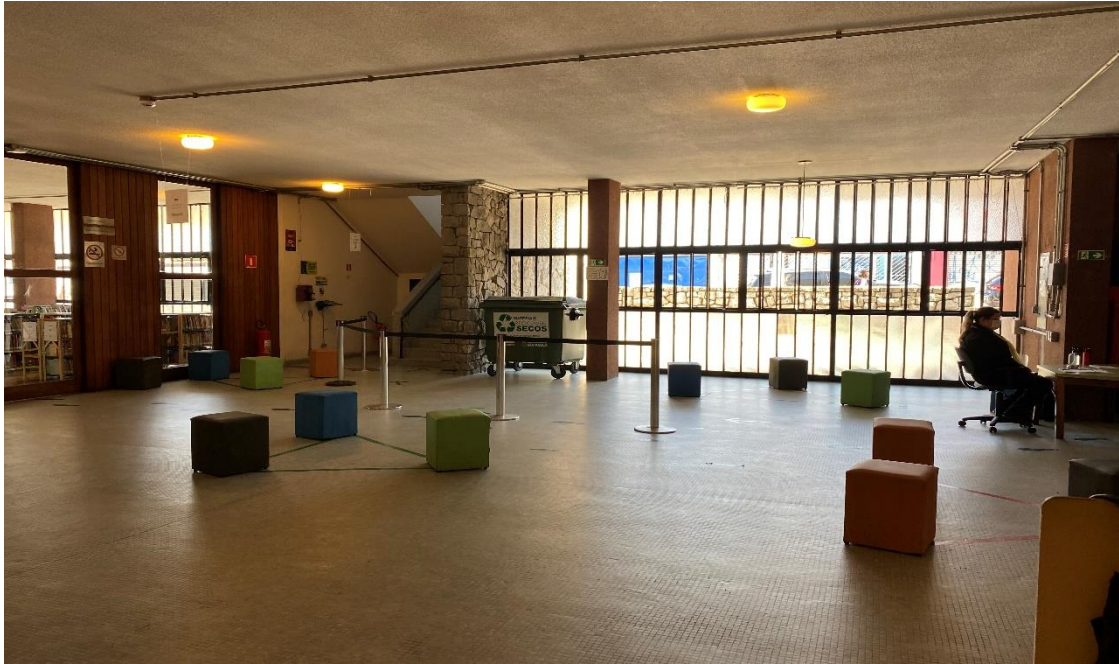
Figura 7– ÁREA DA PERMISSÃO 25