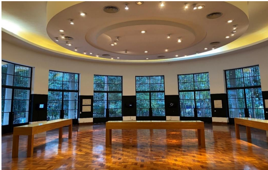
Figura 5 – Área interna da Biblioteca Mário de Andrade