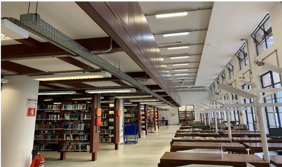
Figura 4 – Área interna da Biblioteca Mário de Andrade