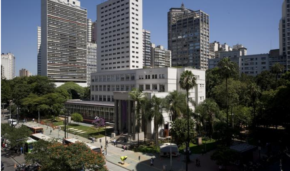
Figura 3 – Fachada da Biblioteca Mário de Andrade