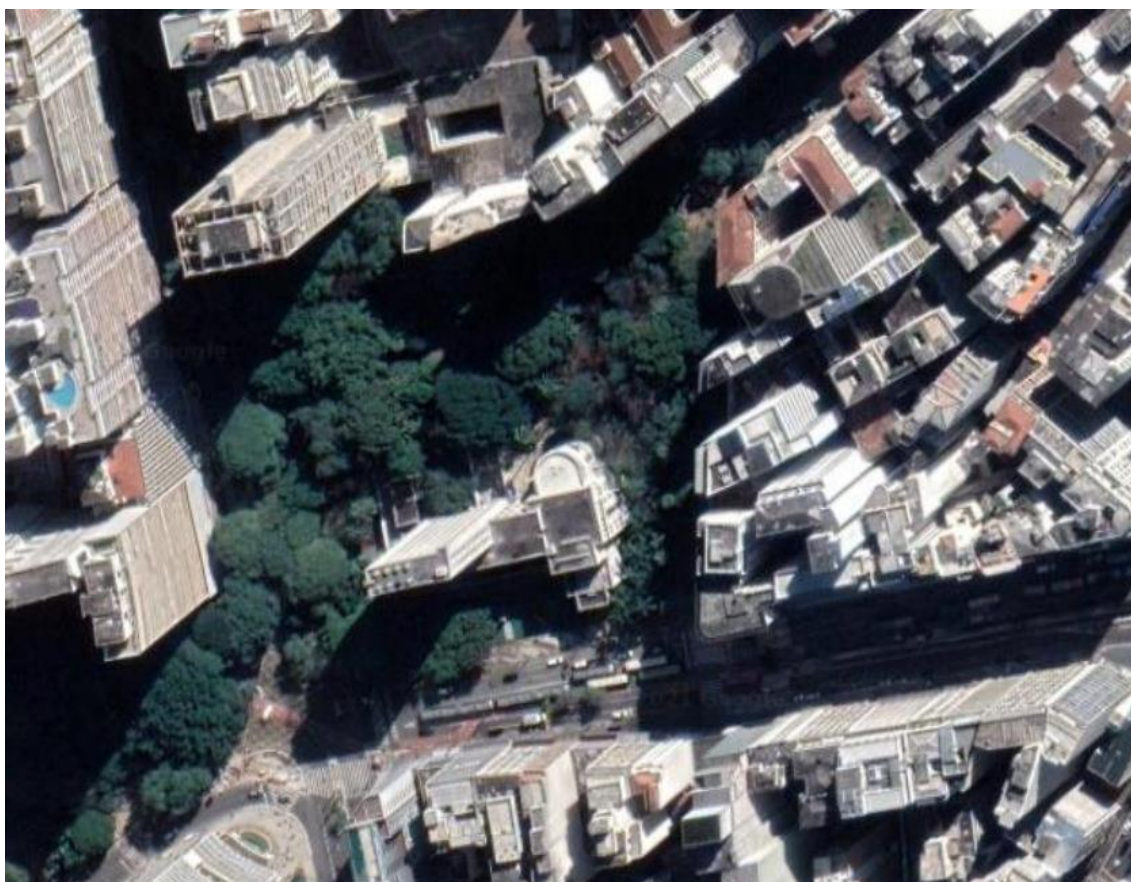
Figura 1 – Localização Biblioteca Mário de Andrade