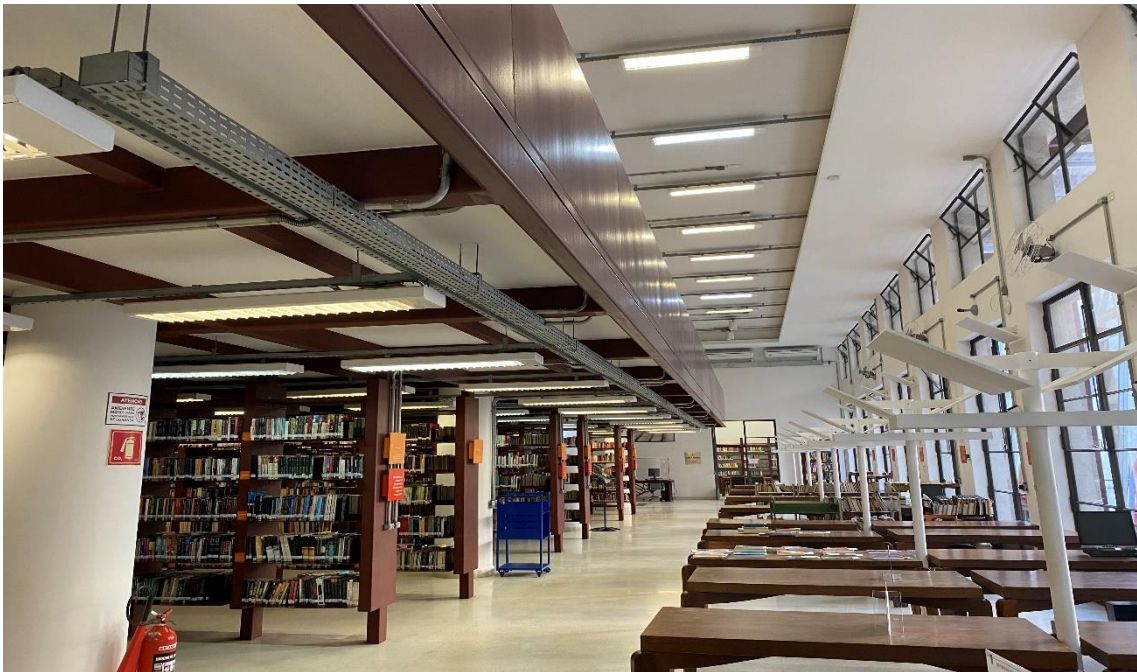
Figura 4 – Área interna da Biblioteca Mário de Andrade