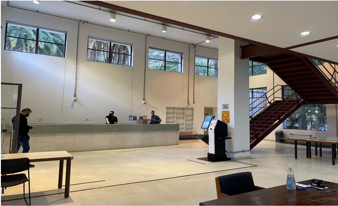
Figura 6 –ÁREA DA PERMISSÃO 22