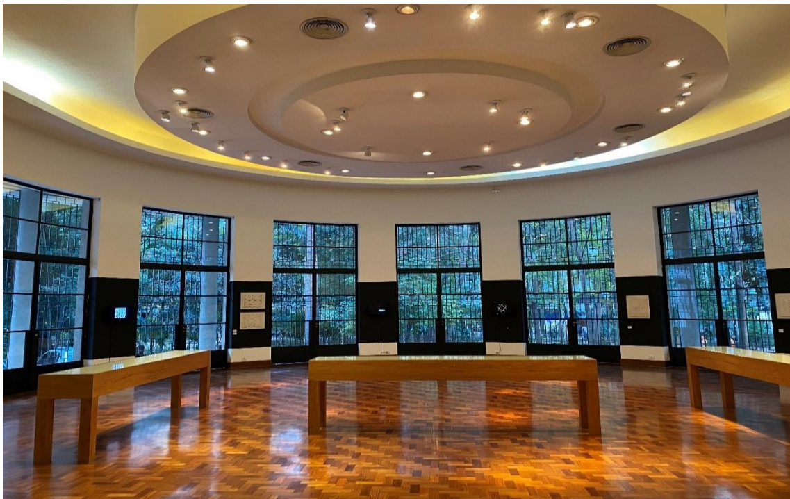
Figura 5 – Área interna da Biblioteca Mário de Andrade