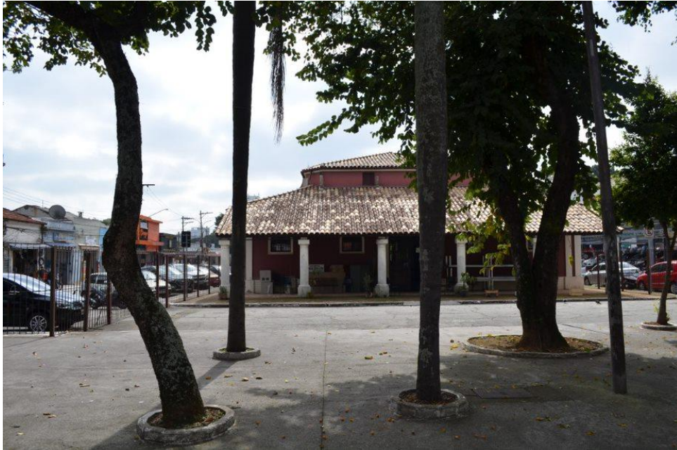
Figura 4 – Praça Dr. Francisco Ferreira Lopes, onde se localiza a Casa de Cultura de Santo Amaro