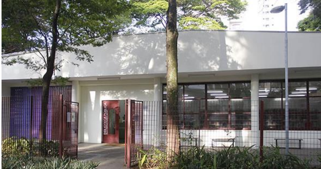
Figura 3 – Fachada da Biblioteca Paulo Sérgio Duarte Milliet