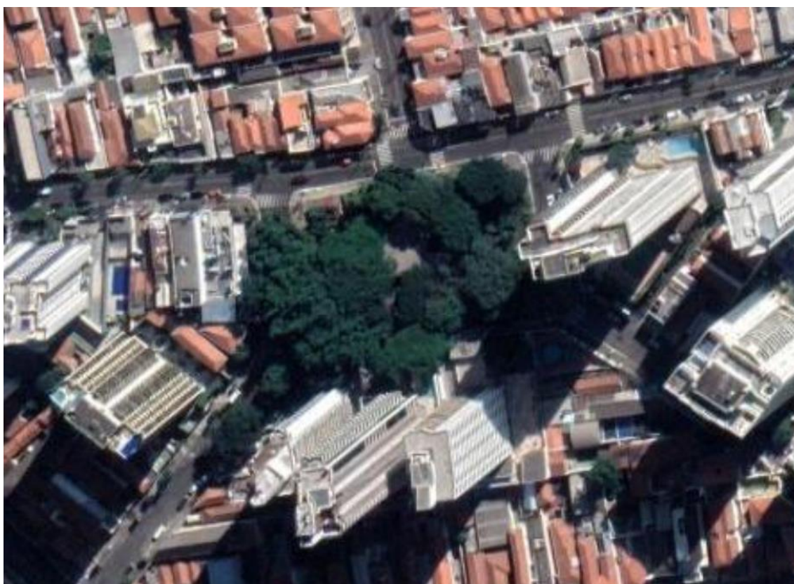
Figura 1 – Imagem de satélite atual