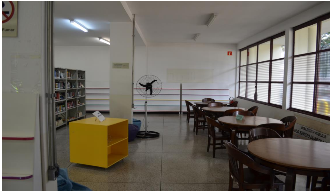
Figura 6 – Área interna da Biblioteca Paulo Sérgio Duarte Milliet