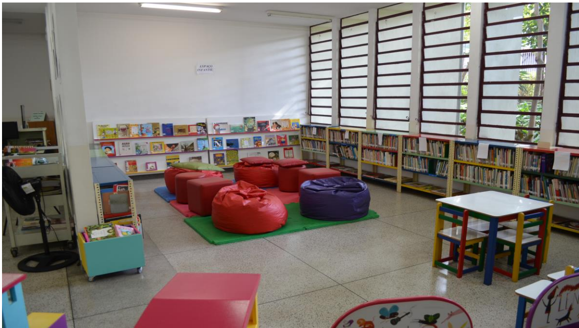
Figura 5 – Área interna da Biblioteca Paulo Sérgio Duarte Milliet