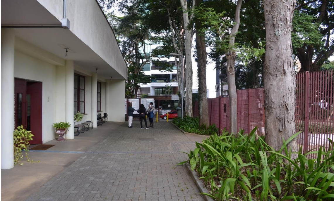
Figura 7 – ÁREA DA PERMISSÃO