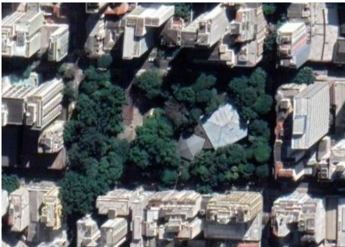
Figura 1 – Imagem de satélite atual

A ÁREA DA PERMISSÃO 18 abrange a combinação da ÁREA DE USO OPERACIONAL e da ÁREA DE INFLUÊNCIA. A primeira com 19,87 m 2 , e a segunda com 53,98 m 2 , ambas pertencentes ao térreo do edifício, próximas à entrada da biblioteca.