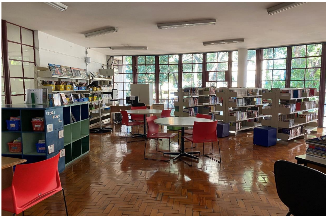
Figura 5 – Interior da Biblioteca Monteiro Lobato