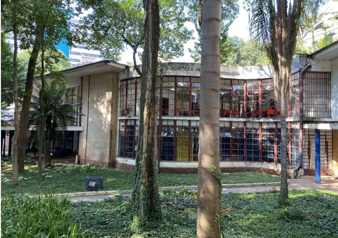
Figura 3 – Fachada da Biblioteca Monteiro Lobato