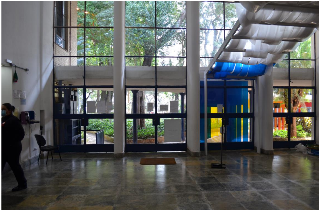
Figura 4 – Interior da Biblioteca Monteiro Lobato